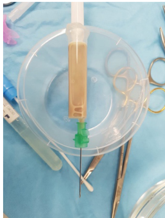
Figura 1. Absceso parafaríngeo izquierdo de aproximadamente 7 ml de volumen y muestra obtenida mediante drenaje transoral bajo anestesia general.