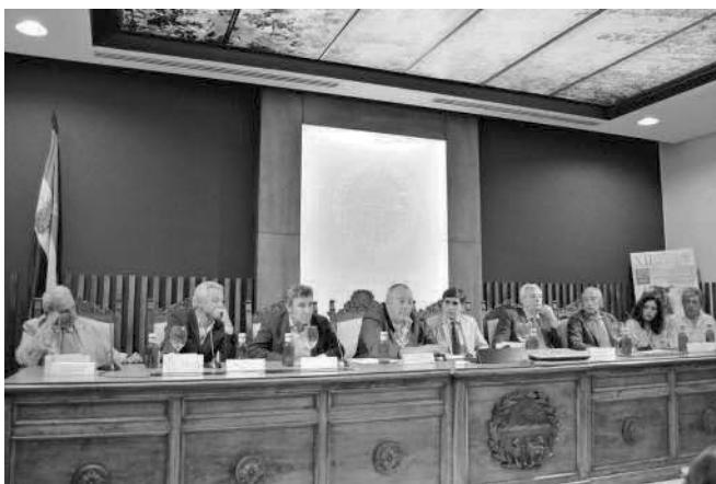
Mesa conformada por ganaderos junto al moderador durante la charla-coloquio