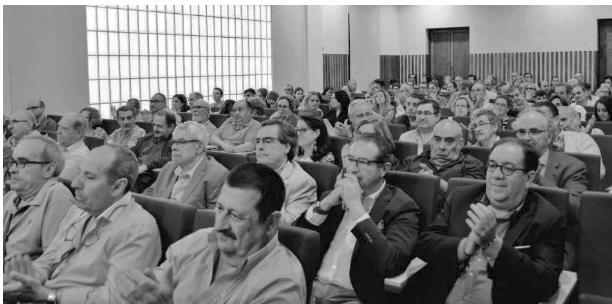
Asistentes al evento

Alrededor de doscientos pacenses se reunieron el pasado 13 de junio en la duodécima edición de la jornada de Convivencia Taurina que se celebra tradicionalmente en el Colegio de Veterinarios de Badajoz desde el año 2008.