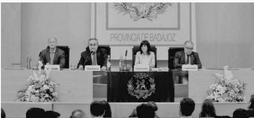
Inauguración del Encuentro Científico

En los últimos años, los casos de leishmaniosis humana y canina han aumentado en Europa, debido al cambio climático y a la presencia del flebotomo durante más meses al año, lo que obliga a seguir aplicando las máximas medidas de prevención en el perro, reservorio de la enfermedad, para ayudar en su control.