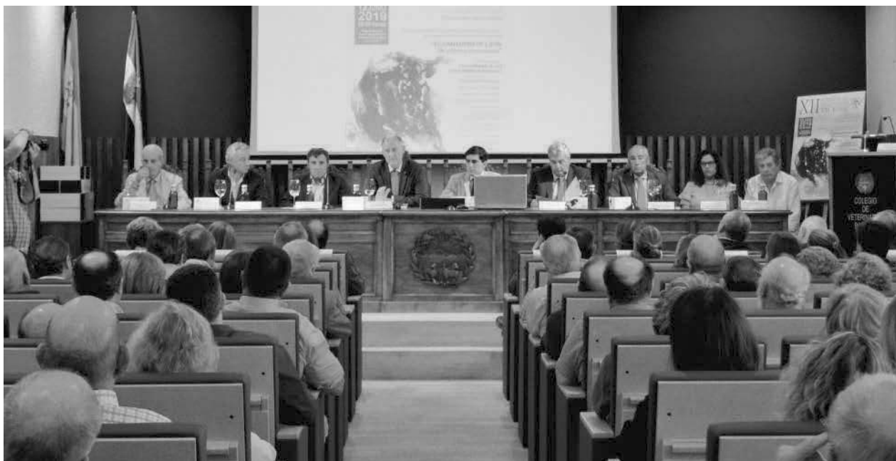
Inauguración de la jornada por el Presidente