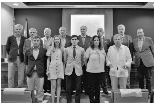
Foto de familia con los protagonistas

Tras el coloquio, en agradecimiento, el Colegio de Veterinarios obsequió a los ganaderos con un toro de forja, una pieza única, totalmente artesanal elaborada en España.