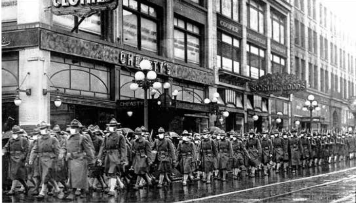
Figura 2 Partida a Francia del 39 Regimiento llevando máscaras proporcionadas por la Cruz Roja Americana. Seattle, Washington, Estados Unidos. 1918