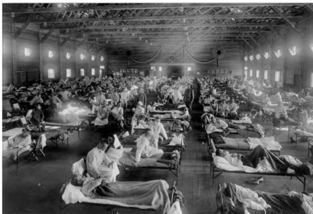
Figura 1 Hospital militar improvisado en Kansas durante la pandemia de gripe en EEUU