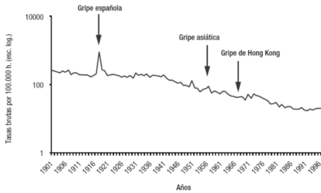
Figura 4 Influencia de la pandemia de 1918 sobre la mortalidad en España, (Mov. Nat. Población, Instituto Nacional de Estadística 1901-1997)