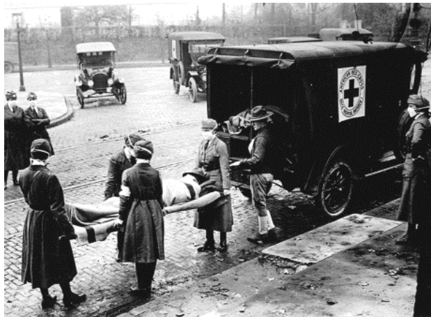
Figura 5 Miembros de la Cruz Roja americana transportando víctimas de gripe española. St. Louis, Missouri, Estados Unidos.