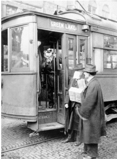
Figura 6 Pasajero rehusado por el revisor de un tranvía por no llevar máscara durante la pandemia de gripe española. Seattle, Washington, Estados Unidos.