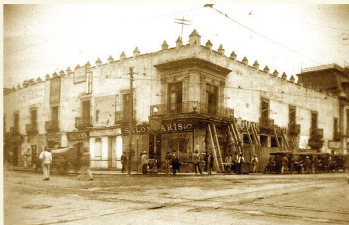
Casa de los mariscales de Castilla en la capital mexicana.