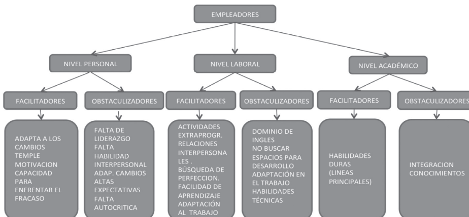
Figura 3: Aspectos que favorecen y desfavorecen el desarrollo profesional desde la perspectiva de los Empleadores.