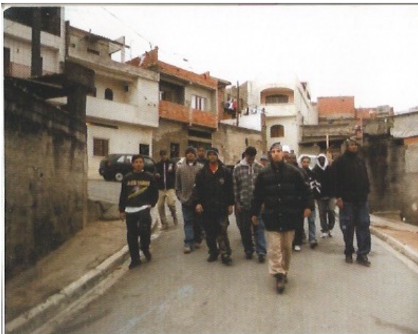
"Atitude vem comigo".

La pose del marginal proclama su presencia a una sociedad que la persigue y la criminaliza, y luego quiere que se mantenga invisible. La leyenda que acompaña la siguiente fotografía lee: "Atitude vem comigo" (La actitud viene conmigo). La foto, tomada por João Wagner e incluida en la primera edición de Capão Pecado , proclama un sentido de identidad visual que asalta el espacio público y exige que otros reconozcan la presencia del marginal. La actitud en la foto es la de una seguridad perceptible que está basada en la existencia de un grupo de apoyo.