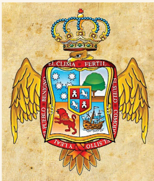
Escudo de Orizaba. En 1776 rey Carlos III concede a sus habitantes el derecho de usar su propio escudo de armas.