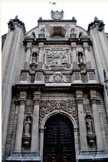
Fachada de la Iglesia de San José el Real de México.