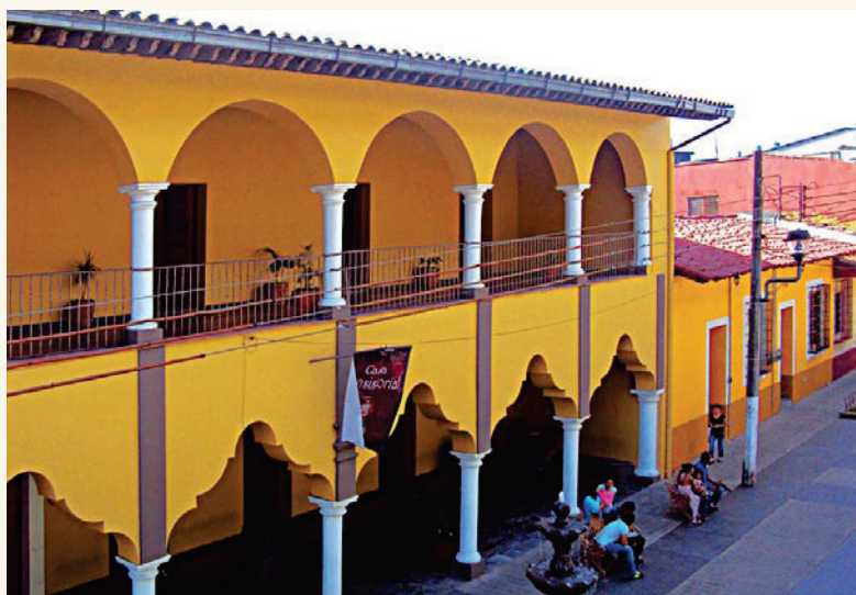
Ayuntamiento de españoles de Orizaba.

indios. Pronto se establecieron españoles, dueños de carros y reuas que circulaban de Veracruz a Méjico, por la facilidad que ofrecía el lugar para realizar la comunicación entre ambas poblaciones. Jurídicamente fue fundado y reconocido como pueblo de indios; en 1553 se forma la República de indios de San Miguel de Orizaba. Sin embargo era un asentamiento donde vivía gran cantidad de familias españolas, mestizas, mulatas y de otras castas. El crecimiento de la población de origen europeo motivó a los vecinos a solicitar de la Corona el privilegio de contar con su ayuntamiento. La erección del ayuntamiento en 1764 llegó de la mano de la implantación del monopolio del tabaco y la elección de Orizaba, Cordoba, Huatusco y Zongolica como los lugares autorizados para sembrar esta planta y para establecer una factoría de puros y cigarros. Una política económica que supuso un cambio económico y social en Orizaba 7 . Trajo consigo un flujo importante de dinero que sirvió, en parte, para la construcción