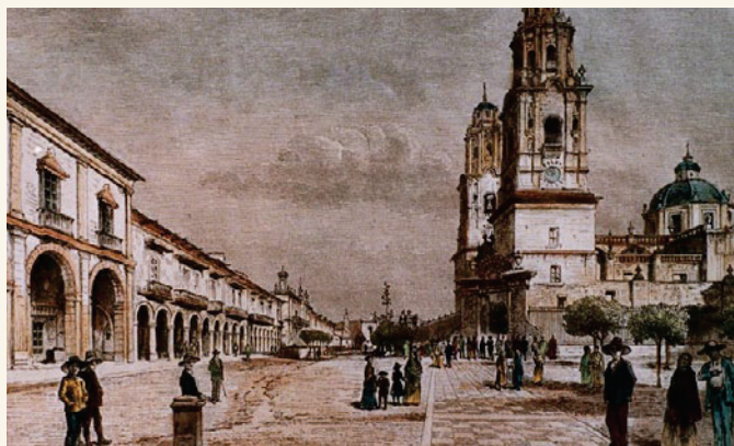
Foto superior: Catedral de Valladolid de Michoacán. Foto inferior: Ayuntamiento de Valladolid de Michoacán.

Juan Sevillano finalizó su mandato como Alcalde Mayor de Orizaba en 1770. Ese mismo año había caído enfermo, impedido para realizar diligencias solicitó licencia al virrey para poner un teniente general en la Villa de Orizaba 10 . Para el 1 de marzo Juan Fernández de Velasco fue nombrado nuevo Alcalde Mayor. El 15 de abril de 1770, el rey concedió una comisión a don Francisco Javier de Losada para tomar residencia a don Juan Sevillano