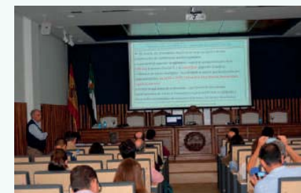
Asistentes al Workshop

Al mismo asistieron 28 colegiados de la provincia de Badajoz interesados en esta materia, en la que ha quedado patente la vital importancia de la función del veterinario.