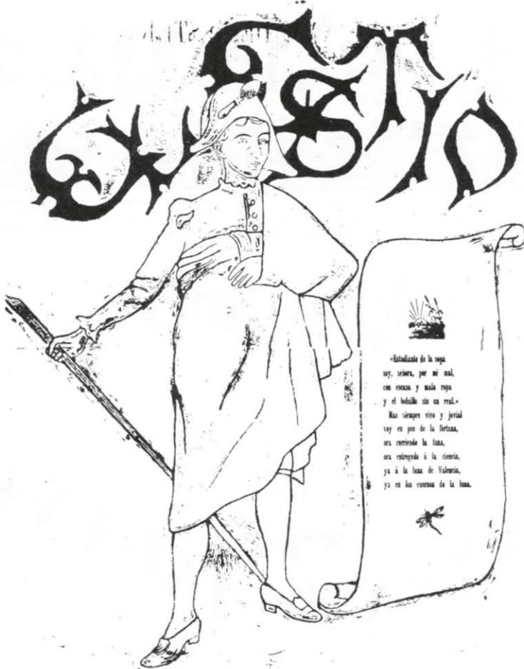
Ilustración perteneciente a uno de los primeros números de «El Estío», en el que se hacía alarde de su condición de «publicación estudiantil».