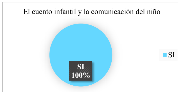
Grafico 2. Análisis frecuencial de la aceptación o no del cuento infantil como ayuda para mejorar la comunicación del niño.