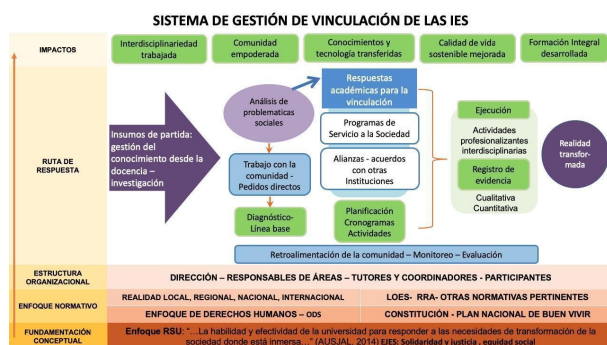
Figura 3. Sistema de Gestión de la Vinculación de las IES

el modelo educativo de la PUCE y la RSU de la AUSJAL se propone el siguiente sistema de gestión de vinculación de las IES (Figura 3):