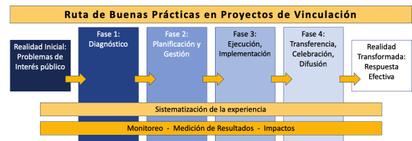
Figura 4. Ruta de Buenas Prácticas en Proyectos de Vinculación

La Figura 4 sintetiza la ruta que siguen las diferentes fases por las cuales transcurren los proyectos de vinculación; su correcta implementación favorece a la consecución de buenas prácticas.