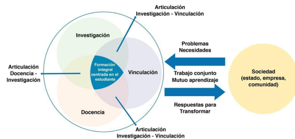
Figura 2. Formación integral centrada en el/la estudiante

Para que la gestión de la vinculación en la Educación Superior sea exitosa, las IES integran el quehacer de sus tres funciones sustantivas: docencia, investigación y vinculación. La complementariedad de estas funciones permite alcanzar la formación integral centrada en el estudiante, un estudiante capaz de responder a los problemas y necesidades de la sociedad (Estado, empresa y comunidad) y proveer respuestas transformadoras. La articulación tripartita de docencia, investigación y vinculación es el camino (Figura 2).