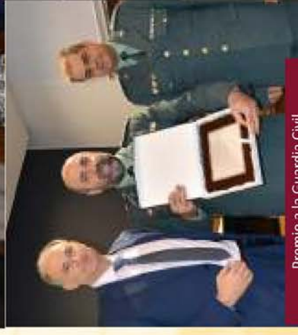
Inicio de la Ceremonia Civil