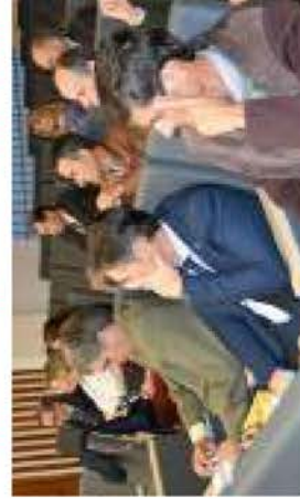
Miembros de la Academia.