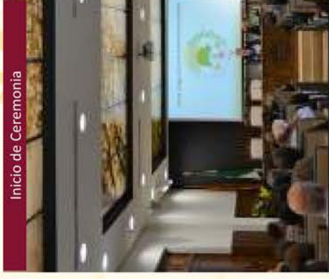
Inicio de Ceremonia