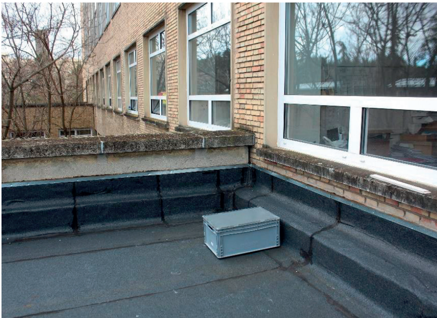
Figura 2: Ubicación de la caja de polietileno estándar con las maquetas de soportes y los dataloggers en su interior, en el exterior de la Facultad de Bellas Artes de la Universidad Complutense de Madrid.

Por este motivo se ha realizado el seguimiento situando cada una de las maquetas dentro de una caja estándar de polietileno dispuesta en el exterior, sin ningún control ambiental, para así poder evaluar con mayor precisión el nivel de aislamiento de cada una de ellas (Figura 2).