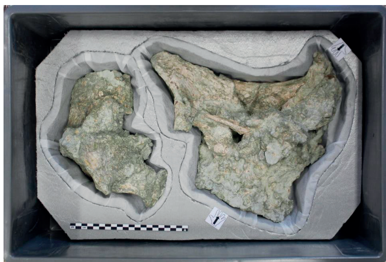
Figura 1: Cajas y soportes usados habitualmente en el almacenaje de material fósil.

Se ha evaluado la capacidad de aislamiento de tres tipos distintos de soporte realizado con tres materiales distintos que, algunos de ellos no pertenecen exclusivamente al campo de la conservación, pero son habitualmente utilizados por su gran estabilidad y economía (San Andrés et al. , 2010). Se han utilizado: la espuma de polietileno (Ethafoam©), el poliestireno extruido y un tejido no tejido de polietileno. Los dos primeros para realizar el soporte sobre el que se ajusta a la pieza a introducir y el tejido de polietileno se coloca en la de poliestireno extruido para evitar el contacto directo del fósil con este material y proteger a la pieza. Estos soportes son los que habitualmente se realizan para la protección de material fósil (San Andrés et al. , 2011; Figura 1).