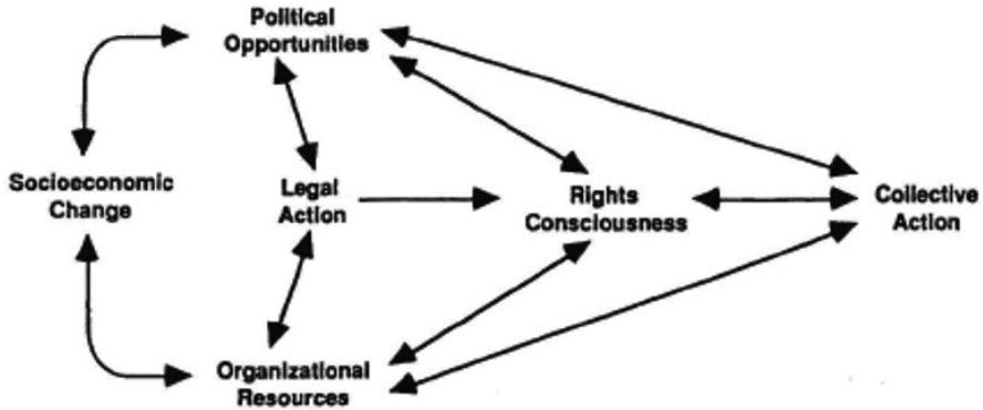
Imagen 1. Contexto social de la movilización legal