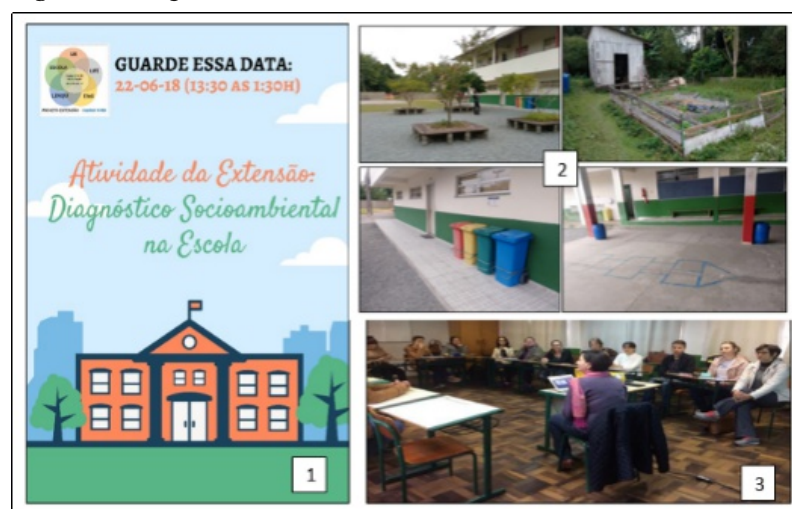
Figura 2 - Diagnóstico socioambiental.

Legenda: 1) Convite para o diagnóstico socioambiental na escola; 2) Exemplos de observações na escola; 3) Reunião na escola para discussão do diagnóstico e eleição dos temas de estudo.