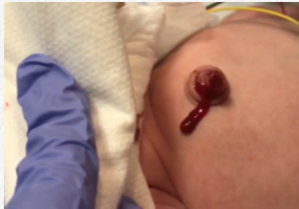
Figura 2. Prominencia umbilical sangrante