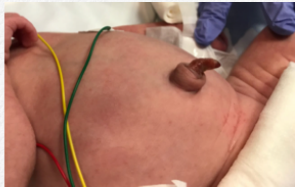
Figura 1. Prominencia umbilical no presente previamente

Tras los hallazgos durante la intervención