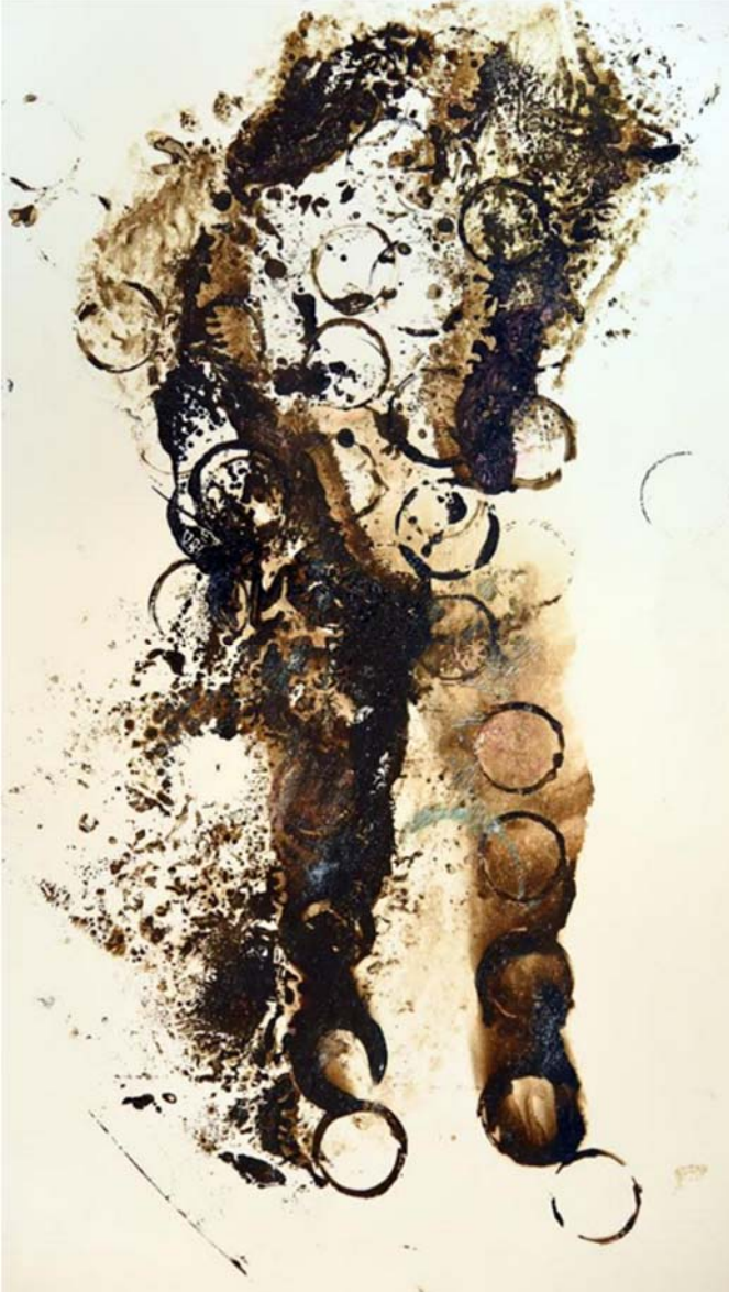
Caminante , monocopias intervenidas. Gustavo Garro