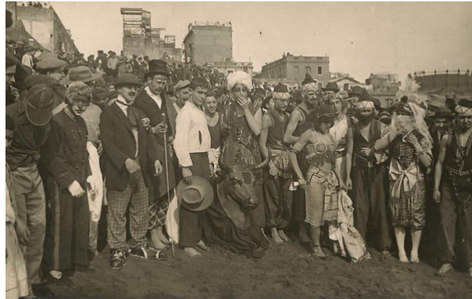
Imagen 2: Concurso carnavalesco en la playa de la Barceloneta organizado por el CNA (Fuente: Archivo familia Masses)

contribuyeron al éxito de la fiesta. (Fuente: El Mundo Deportivo, 20 de febrero de 1917)