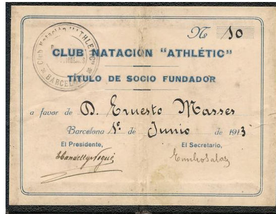
Imagen 1: Título de Socio Fundador del CNA