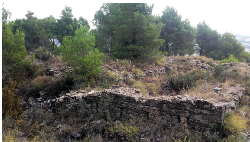
Ruinas de la ermita Santa Margarita, izquierda, y fuerte liberal de 1875, en primer plano a la derecha. Vista del lateral oeste.