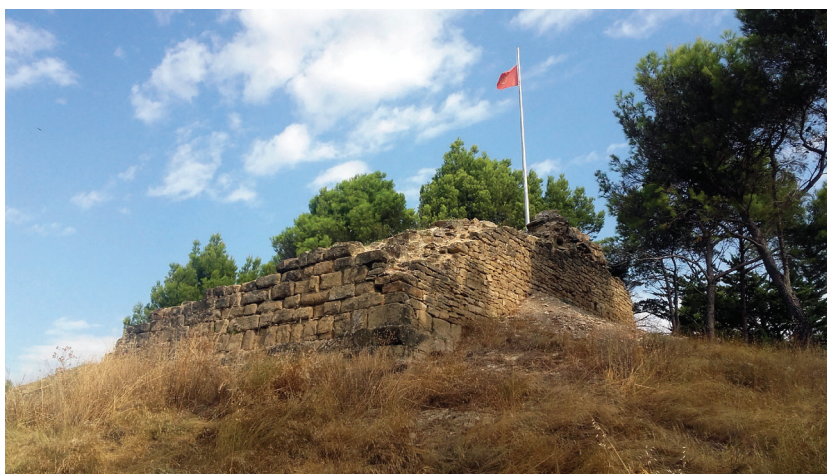
Torre del homenaje del Castellón del siglo XII, que en 1875 sirviera para la utilización como fuerte liberal.