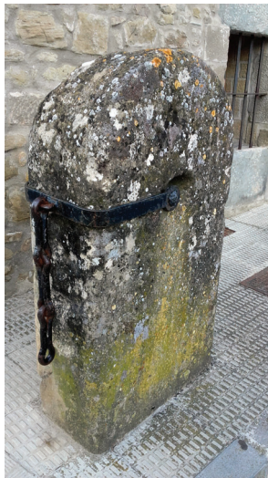
Uno de los extremos de la cadena que cortaba la circulación en la carretera junto al puente, para el cobro de los arbitrios o impuestos, en la casa del Portazgo, en la Rochapea de Sangüesa.

pueblo de sus bienes, como pudo verlo en la Ley 15 de Diciembre de 1795 dada precisamente para la construcción de portazgos que se establecieron en la carretera de Noáin a Sangüesa en la que se mandó que se hicieran con fondos de la provincia, y no como por lo visto pretende ahora se haga con una piedra de Sangüesa.