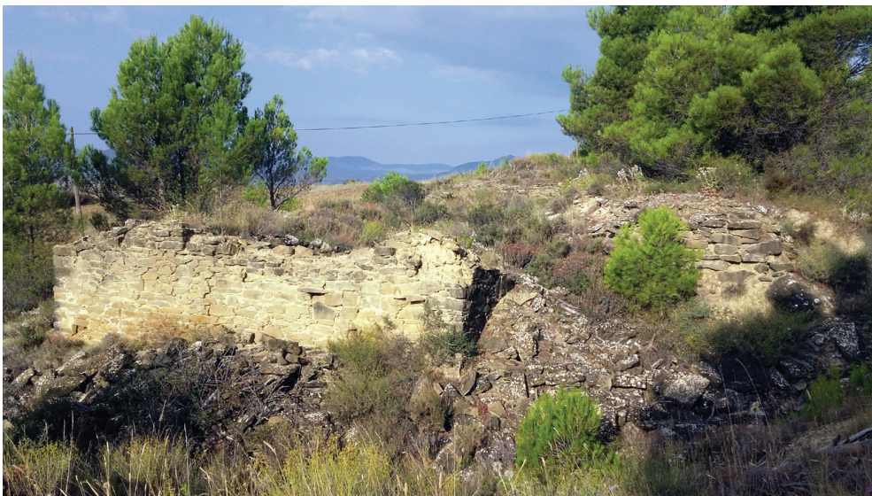
Ruinas de la ermita Santa Margarita, derecha de la imagen, y fuerte liberal de 1875, a la izquierda. Vista del lateral este.