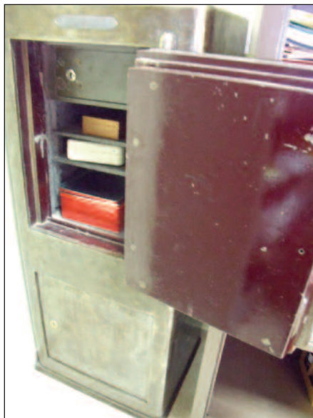
Dues fotografies recents de la caixa forta

Fent un salt en el temps, ens situem als anys 30 del segle XX. A l'Ajuntament de Constantí tenim un govern d'esquerres de tendència republicana. L'oposició està formada per membres conservadors, que fins llavors havien governat l'Ajuntament i encara no havien paït trobar-se fora del govern; per tant, no és d'estranyar que les seves crítiques fossin molt dures, pronosticant uns mals auguris pel poble de Constantí.