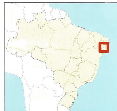
Figura 1: Poblaciones de Melocactus violaceus Peiff. subsp. margaritaceus N.P. Taylor (Cactaceae), estado de Sergipe, noreste de Brasil mostrando las dos zonas de estudio caatinga: Mata Atlântica en el Parque Nacional Sierra de Itabaiana; restinga: en La Playa de Pirambu.