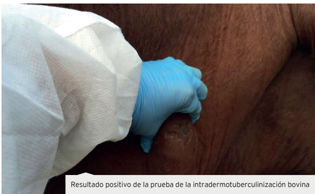
Resultado positivo de la prueba de la intradermotuberculinización bovina

actividad ganadera entre otras y en nuestra región, Extremadura donde este sector tiene tanta importancia se encontraban trabajando muchos compañeros veterinarios, desempeñando una excelente labor dentro del Proyecto de Saneamiento Gana-