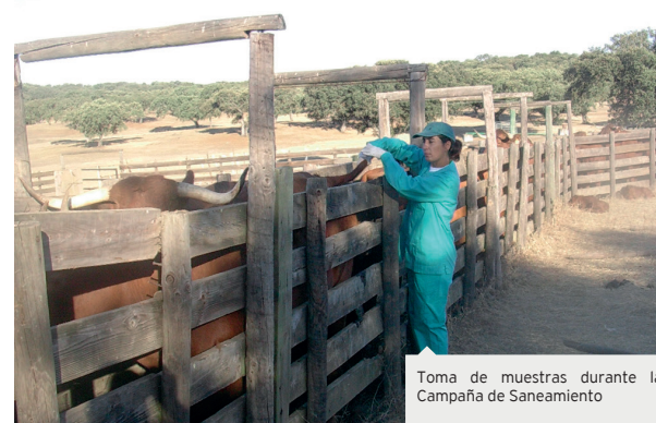
Toma de muestras durante la Campaña de Saneamiento

mayo de 2014 se declare nulo el PDC y se obligue a la empresa Tragsatec a readmitir a sus trabajadores. Quizás, lo más asombroso e increíble de este relato es que después de la sentencia favorable a los trabajadores, Tragsatec que debiendo cumplir la ley readmite a los mismos, les exonera de sus servicios para la empresa, es decir, las personas anteriormente despedidas vuelven a ser trabajadores en plantilla pero no van a trabajar, no realizan labor alguna para la empresa, al igual ocurre con otras categorías como auxiliares de laboratorio y técnicos superiores... En mayo del año 2015 un año después de la sentencia de la Audiencia Nacional, los veterinarios readmitidos fueron entonces llamados para volver a sus respectivos puestos, pero poco después vuelven a prescindir de sus servicios. Todo cambia en octubre de este mismo año; los argumentos que en un principio fueron rechazados por la Audiencia Nacional e incluso tacharon de inconstitucionales, fueron aprobados por el Tribunal Supremo, por lo que a partir de esta fecha en adelante