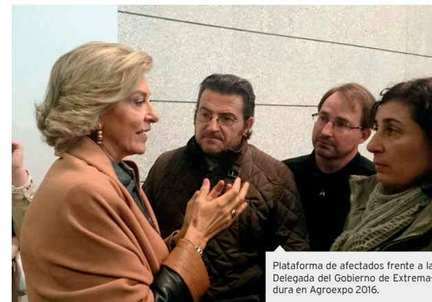
Plataforma de afectados frente a la Delegada del Gobierno de Extremadura en Agroexpo 2016.

Todo empezó en el año 2011 cuando la crisis acechaba ya en nuestro país y en la empresa Tragsatec dada la situación económica se planteó el primer ERE. Desde entonces y durante los dos años siguientes se llevaron a cabo dos ERES suspensivos y un ERE extintivo parcial de 80 personas (denegado por la Autoridad Laboral), pero no fue realmente hasta septiembre del año 2013 cuando comenzó el Proceso de Despido Colectivo (PDC) a nivel nacional (ya que tras un período de negociación con los sindicatos no lograron llegar a ningún tipo de acuerdo). En los dos primeros meses del año 2014 comienzan a ejecutarse los despidos en Extremadura, concretamente a 59 trabajadores. Cabe resaltar que dichos despidos ocurren al inicio de la Campaña de Saneamiento Ganadero afectando a gran parte de los profesionales veterinarios que trabajaban en la Campaña. (En ese momento ya no existe la figura de la Autoridad Laboral