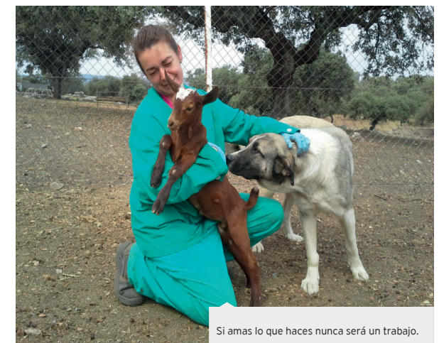
Si amas lo que haces nunca será un trabajo.

sensiblemente los elevados niveles de prevalencia de la tuberculosis bovina en Extremadura. La Organización Colegial Veterinaria Extremeña aboga por la readmisión de dichos profesionales y anima al Ejecutivo Regional para que negocie dicha medida con la empresa pública TRAGSA y además refuerce la plantilla de los Veterinarios Oficiales dependientes del Servicio de Sanidad Animal para un mejor servicio.