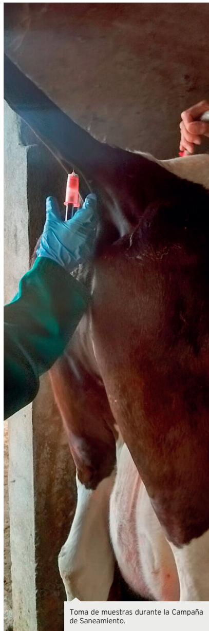
Toma de muestras durante la Campaña de Saneamiento.

se ha llevado a cabo la ejecución del ERE que ha afectado a nivel nacional a 1336 empleados pertenecientes a la empresa Tragsa.