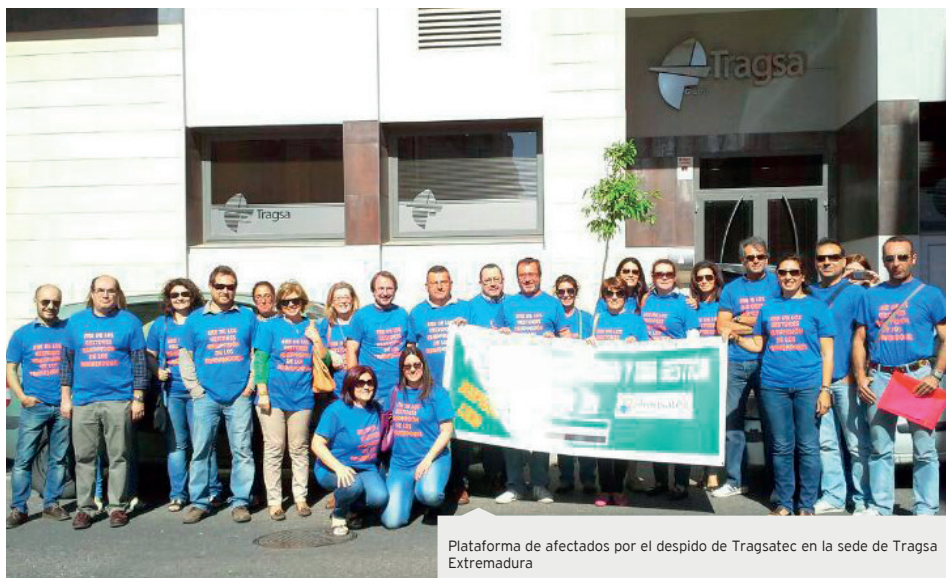
Plataforma de afectados por el despido de Tragsatec en la sede de Tragsa Extremadura