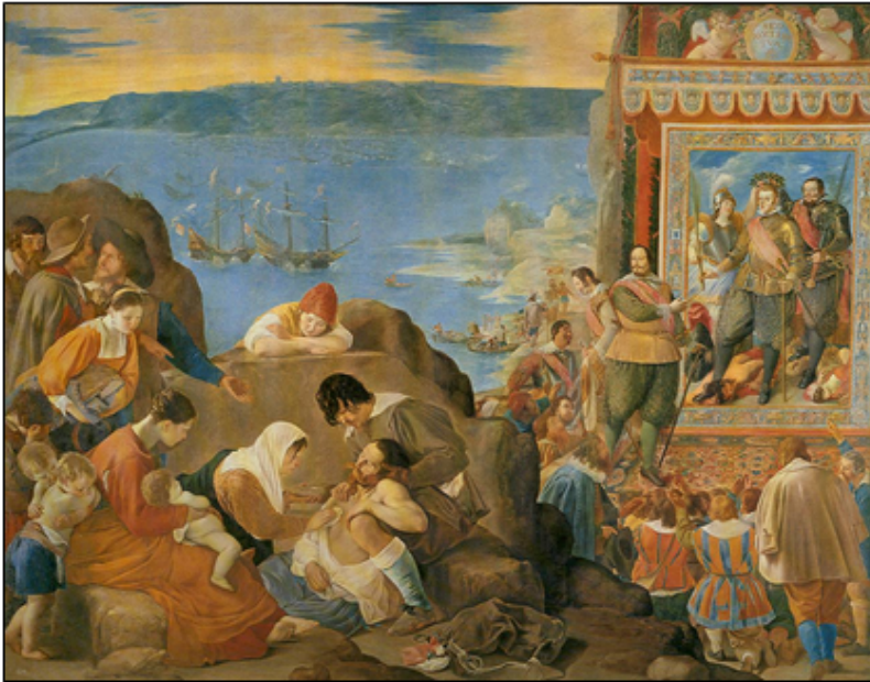
Fig. 6 La recuperación de Bahía de Todos los Santos [1625]. Juan Bautista Maino. Madrid, 1634-1635, Museo del Prado.

Fueron muchas las relaciones del suceso en la época, dado que la de Bahía fue una victoria famosa. También proliferaron las representaciones visuales en clave topográfica o militar, circunstancia aprovechada por el pintor para recrear la ciudad. Mayor duda generan, a primera vista, los hechos concretos de la pérdida 98 y