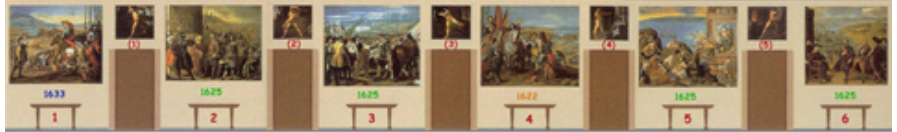
Fig.5 Reconstrucción del Salón de Reinos según J. Brow i J. H. Elliott ( Un palacio para el Rey. El Buen Retiro y la corte de Felipe IV. Madrid, 1981, fig. 92 ).

especialización en los sucesos históricos de la España de la época.