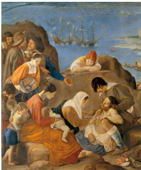
Fig. 7 «Por estos desiertos campos viejos, niños y mujeres que es lástima de mirarlos»