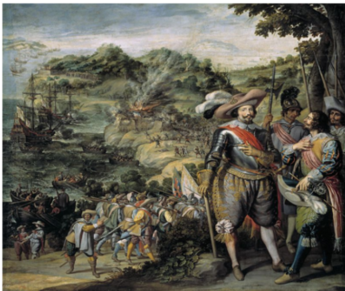
Fig. 4 La recuperación de la isla de San Cristóbal por don Fadrique de Toledo [1629]. Félix Castelo. Madrid, 1634, Museo del Prado.

ingleses y franceses. El comandante puso en fuga a los intrusos y quemó sus plantaciones de tabaco pero, al no dejar un contingente defensivo importante en la isla y antes de que Félix Castelo rindiera cumplido testimonio de la hazaña en un lienzo, los colonizadores ya habían regresado. En la expedición llevada a cabo por don Fadrique le acompañaban otros nombres importantes: don Martín de Valdecilla, general de la flota; el almirante don Antonio de Oquendo; y don Tiburcio Redin 91 . Lo efímero de los éxitos no restaba mérito a su presencia en el Salón de Reinos; era una victoria en Ultramar y eso bastaba.