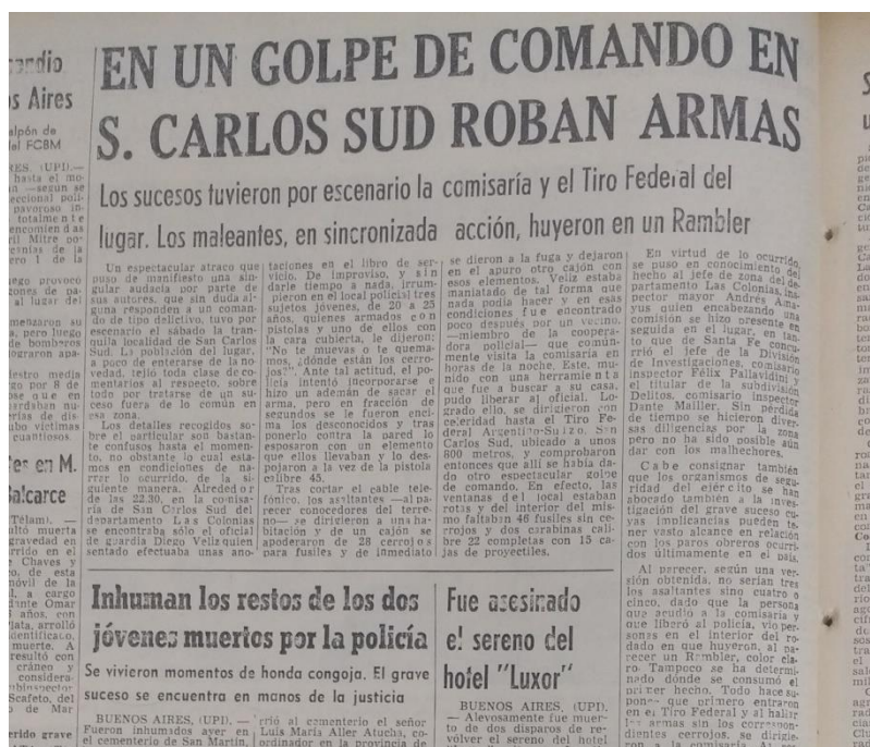
El Litoral, Santa Fe. 22/09/69. Archivo Provincial de la Memoria de Santa Fe.

Las autoridades locales contemplaron el establecimiento de mecanismos basados en el consenso, en el marco de despliegue de una profunda estrategia de disciplinamiento social. En efecto, los municipios y comunas fueron concebidos como espacios privilegiados para la construcción de las bases de legitimación de la dictadura (Lvovich, 2010: Ponisio, 2016b). A escala local, el régimen militar también aplicó diferentes estrategias represivas y desarrolló políticas que apuntaban a considerar las especificidades locales “proporcionando respuestas flexibles a demandas diversas, sin descontar la posibilidad de promover diseños ‘específicos’ adaptados a necesidades y demandas locales muy concretas” (Ponisio; 2016b). En este contexto, la imagen heredada de la “pampa gringa” como un espacio próspero y al margen de las disputas políticas de los años sesenta y setenta tambalea cuando identificamos las acciones armadas que se desarrollaron en la región en esa época. Las mismas han sido escasamente reseñadas hasta el momento (Lanusse, 2007:76).