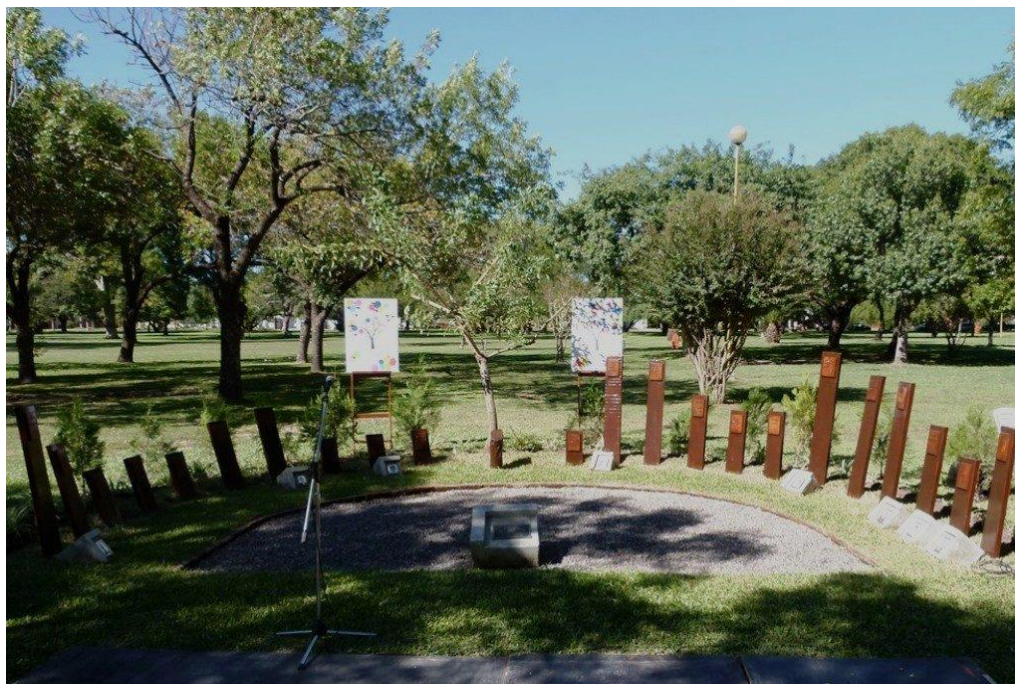
Espacio de la Memoria en Homenaje a los desaparecidos de Esperanza.

El pasado reciente, y en especial los años de la dictadura cívico militar en nuestro país, son objeto de debates y controversias en la esfera pública (Servetto; 2016: 11), por lo cual el memorial de Esperanza se erige como un puntal clave para la construcción de la memoria social. Aquí se hacen visibles las luchas por las memorias y los sentidos sociales del pasado de represión política y terrorismo de estado, revelando cuestiones clave sobre las posiciones y apuestas del presente (Cfr. Vezzetti, 2003).