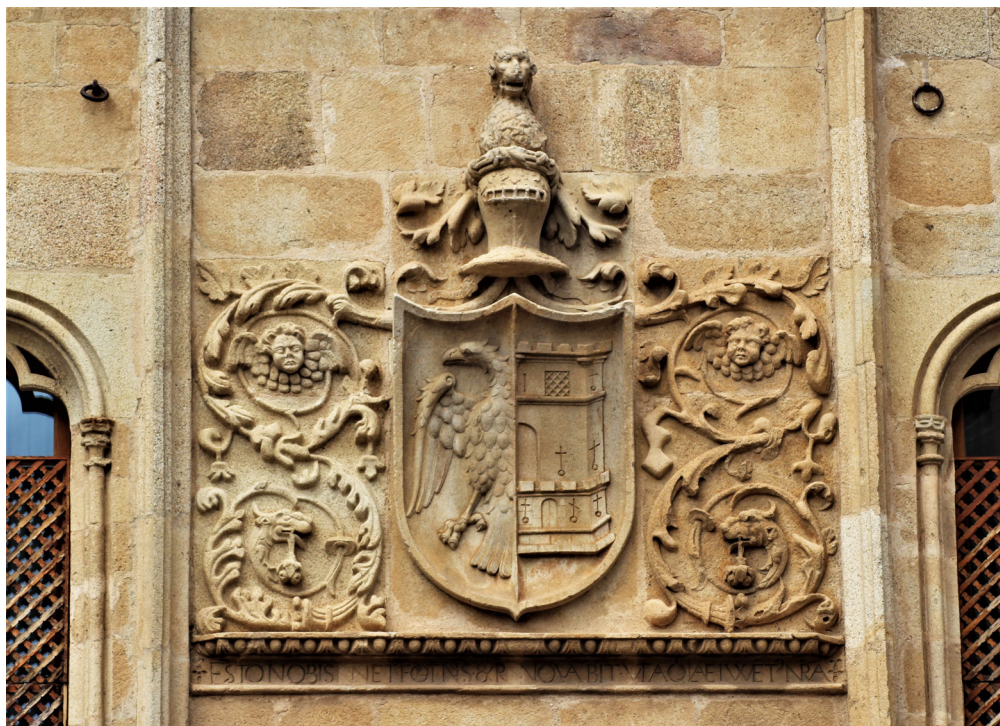
7. Palacio de Mayoralgo, Cáceres. Blasón de los Blázquez-Mayoralgo sobre la portada principal

La segunda etapa constructiva se inicia en el año 1534, cuando tiene lugar la realización de una nueva fachada principal que da a la plaza de Santa María, proyecto de acondicionamiento de este frente del edificio que ha de entenderse en el marco del proceso generalizado de adaptación de antiguas casas de modestas dimensiones y carácter eminentemente castrense a mansiones más espaciosas y habitables que se está produciendo en el conjunto monumental cacereño 32 . De acuerdo con De Mayoralgo y Lodo (2004: 118-119), fue Paulo de Mayoralgo quien acomete esa importante obra, que suponía al mismo tiempo una remodelación a gran escala de todo el inmueble a costa de la adquisición de casas colindantes y alguna calleja pública, en una clara combinación de elementos góticos y renacentistas.