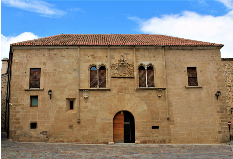
6. Palacio de Mayoralgo, Cáceres. Vista general de la fachada principal actual