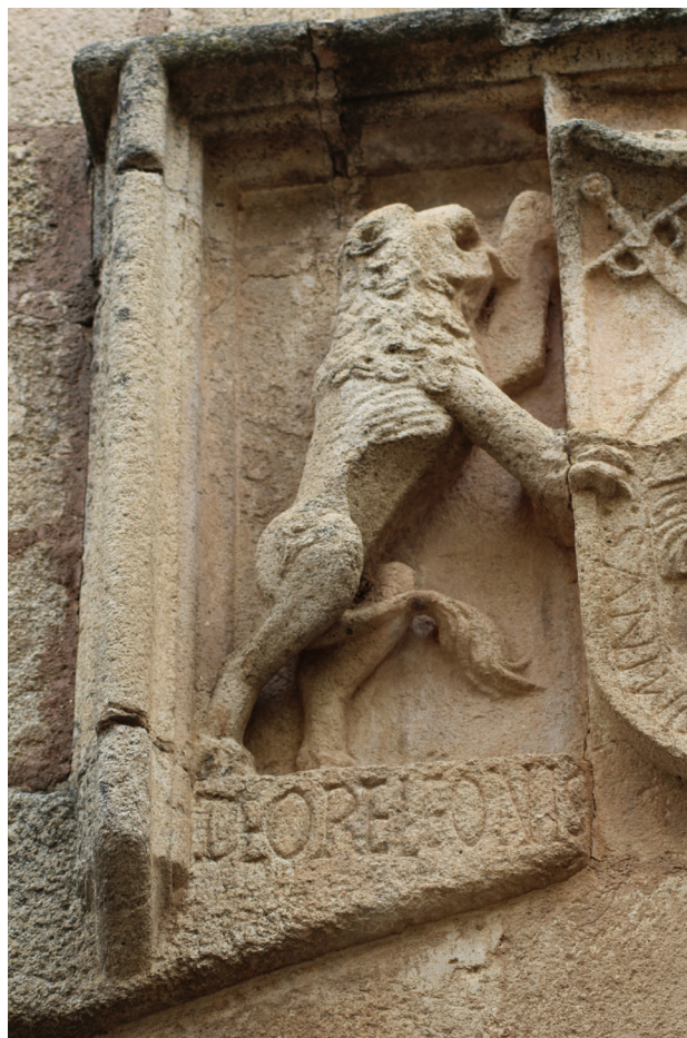
3. Casa-palacio de los Espadero-Pizarro o de Cáceres-De los Nidos, Cáceres. Detalle del león tenante izquierdo e inscripción en la base del blasón principal sobre la portada

Otra fuente factible es la exclamación Salva me ex ore leonis procedente del salmo 22, 17-22 –salmo 21 en la Vulgata –, si bien, como puede observarse, sustituyendo la partícula de por ex : «Perros innumerables me rodean, / una banda de malvados me acorrala / como para prender mis manos y mis pies / [...] ¡Mas tu Yahveh, no te estés lejos, / corre en mi ayuda, oh fuerza mía, / libra mi alma de la espada, / mi única de las garras del perro; / sálvame de las fauces del león, / y mi pobre ser de los cuernos de los búfalos!» 16 . Debe tenerse en cuenta, de cara a la posible interpretación de esas palabras en el blasón cacereño, que proceden de la elegía de un justo que se siente alejado de su Dios y se queja de un abandono que considera inmerecido; rodeado de fieros enemigos, presente la proximidad de la muerte y por ello implora auxilio a su Señor, que parece haber ocultado el rostro a sus sufrimientos. El salmista pide de este modo a Yahveh, su única fuerza y auxilio, que no le ignore, recurriendo para ello a metáforas llamativas y gráficas como las alusiones a las fauces, garras o cuernos de distintos animales feroces o agresivos.