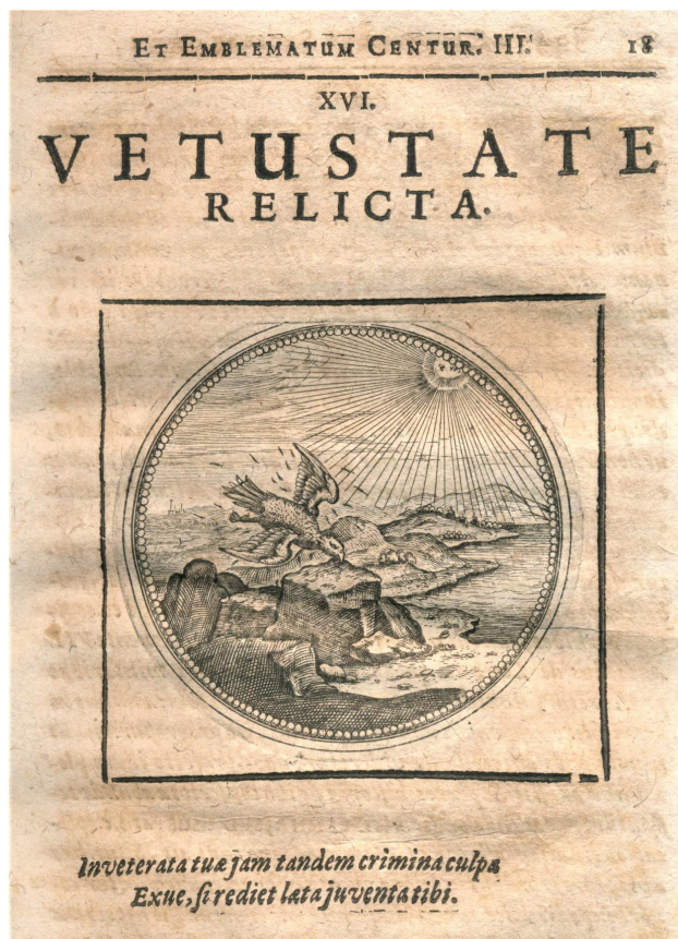
10. Joachim Camerarius, Symbolorum et emblematum ex volatilibus et insectis desumptorum centuria tertia , Frankfurt, 1654. Emblema 16

sa 6, Vetustate relicta —«Una vez abandonada la vejez»—, o un emblema de Nicolás Reusner (1581: lib. II, emblema 38, pp. 101-102, Renovata iuventus ), quien escribe al respecto: «Quien es piadoso, y se purifica en la sagrada fuente de la salud, nunca es herido por el fulmíneo fuego de Júpiter. Y así la fe verdadera es protegida por la voluntad celeste, y la luz la atrae en seguida con su resplandor. Cristo es el Sol de Justicia, y la vida eterna, que mantendrá a salvo a quien descubra con un corazón sencillo». Ambas etapas del proceso de rejuvenecimiento —la pérdida de las plumas y la ruptura del viejo pico— aparecen fundidas en la pictura de uno de los emblemas ornitológicos del alemán Joachim Camerarius (1654: emblema 16, fols. 18r y v), que reitera el lema de la empresa de Borja, y en cuyo epigrama nos advierte: «Arranca ahora, finalmente, los viejos pecados de tu culpa, si quieres que vuelva a ti la alegre juventud» [10] 45 .