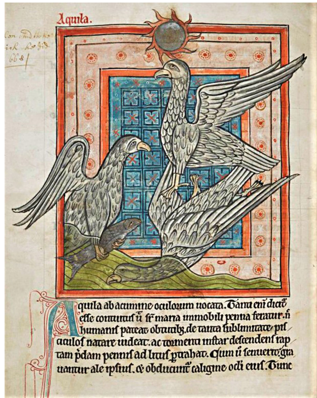
9. Proceso de rejuvenecimiento del águila. Bestiario latino , segundo cuarto del s. XIII, Londres, British Library, Harley MS 4751, fol. 35v

A causa de la popularidad del asunto en los siglos del medievo, la literatura simbólica moderna se hará eco de tan llamativa propiedad del águila: es el caso de una obra tan influyente como los Hieroglyphica de Pierio Valeriano, autor que recoge la leyenda del rejuvenecimiento del ave a partir de diversas autoridades medievales, así como la manera en que esta elimina la excesiva curvatura de su pico gracias a la auctoritas de Agustín de Hipona. Todo ello convierte a la reina de las aves, según este autor, en jeroglífico de «La juventud renovada», entendiéndose con ello «[...] la limpieza