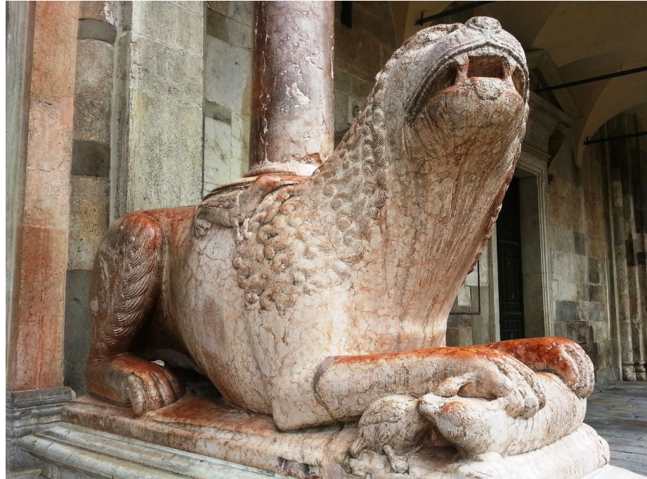
4. Giovanni Bono de Bissone, león estilóforo sujetando entre sus garras a un oso y un ave, c. 1283. Cremona, catedral, vestíbulo de la entrada principal

pondrán de manifiesto sin ambigüedades la doble vertiente de la orientación simbólica del animal. Agustín de Hipona, por ejemplo, escribe: