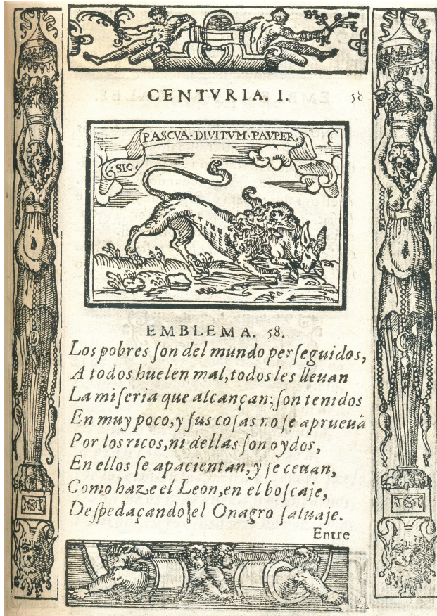
5. Sebastián de Covarrubias, Emblemas morales , Madrid, 1610. Centuria I, emblema 58

Las alegorizaciones del león en las distintas versiones del Fisiólogo son esencialmente cristológicas, estableciéndose un triple paralelo entre distintas propiedades naturales asignadas al animal y otras tantas atribuciones del Mesías. Sin embargo, en algunos bestiarios encontramos un significado opuesto: como señala Mariño Ferro (1996: 280), el león que busca una presa significa en el Bestiario Valdense al Demonio que acecha al pecador.