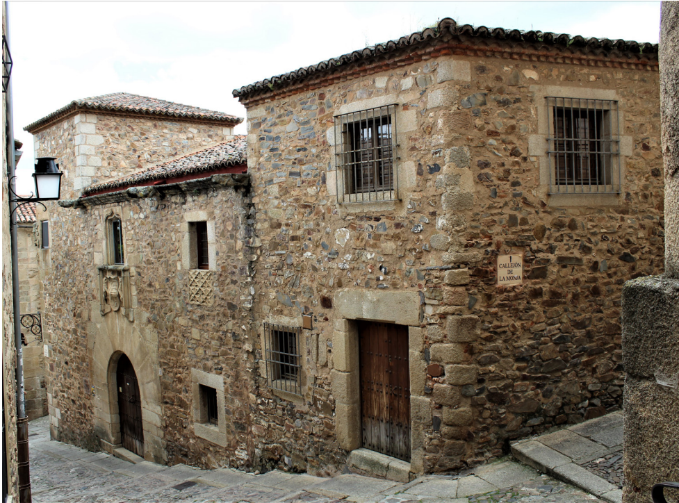
1. Casa-palacio de los Espadero-Pizarro o de Cáceres-De los Nidos, Cáceres. Vista general del frente de fachada

En el piso alto aparece una galería con antepecho y arcos también rebajados. Pero, sin duda, el elemento más llamativo de este espacio es la escalera de cantería de dos tramos de ida y vuelta, con barandas de granito, que se dispone en el lado norte; al final del primer tramo, en el muro de la escalera y arranque del barandal superior, hay una escultura en piedra que representa a un mono atado con una cadena y debajo una pequeña ventana cuadrada por la que se asoma un rostro humano con marcados rasgos étnicos 7 . Diversos detalles decorativos góticos perviven en varias portadas y antepechos de ventanas; las habitaciones se cubren con techumbre plana con viguerías de madera o bóvedas de aristas de ladrillo (Andrés y Pizarro, 2006: vol. I, pp. 215-217; Mogollón, 1995b).