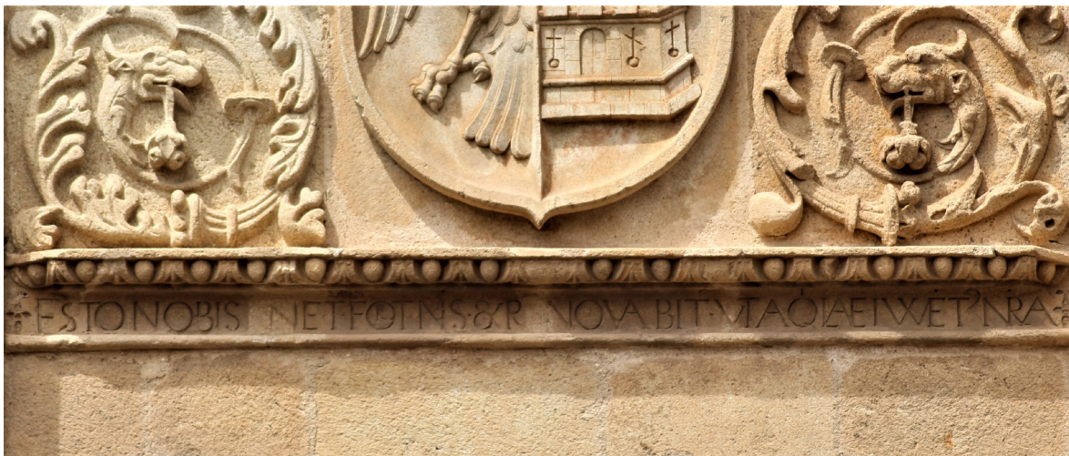
8. Palacio de Mayoralgo, Cáceres. Detalle de la inscripción bajo el blasón principal de los Blázquez-Mayoralgo

En julio de 1937, en plena Guerra Civil, la fachada principal y la primera crujía quedaron destruidas como consecuencia de un bombardeo aéreo; afortunadamente, el gran escudo principal cayó en un solo bloque y resultó intacto salvo algunos daños menores en los lambrequines de la parte derecha. Este frente será reconstruido por la Dirección General de Bellas Artes siguiendo y respetando fielmente el modelo original, y experimentando después nuevas reformas emprendidas por la familia propietaria, especialmente en los años 1959-60. En 1992 el inmueble fue adquirido como Centro de Gestión Catastral y Cooperación Tributaria del Ministerio de Economía y Hacienda, aunque permanecería sin ser ocupado desde entonces; posteriormente fue vendido a la Caja de Ahorros de Extremadura, de la que es en la actualidad, tras una profunda remodelación, sede institucional.