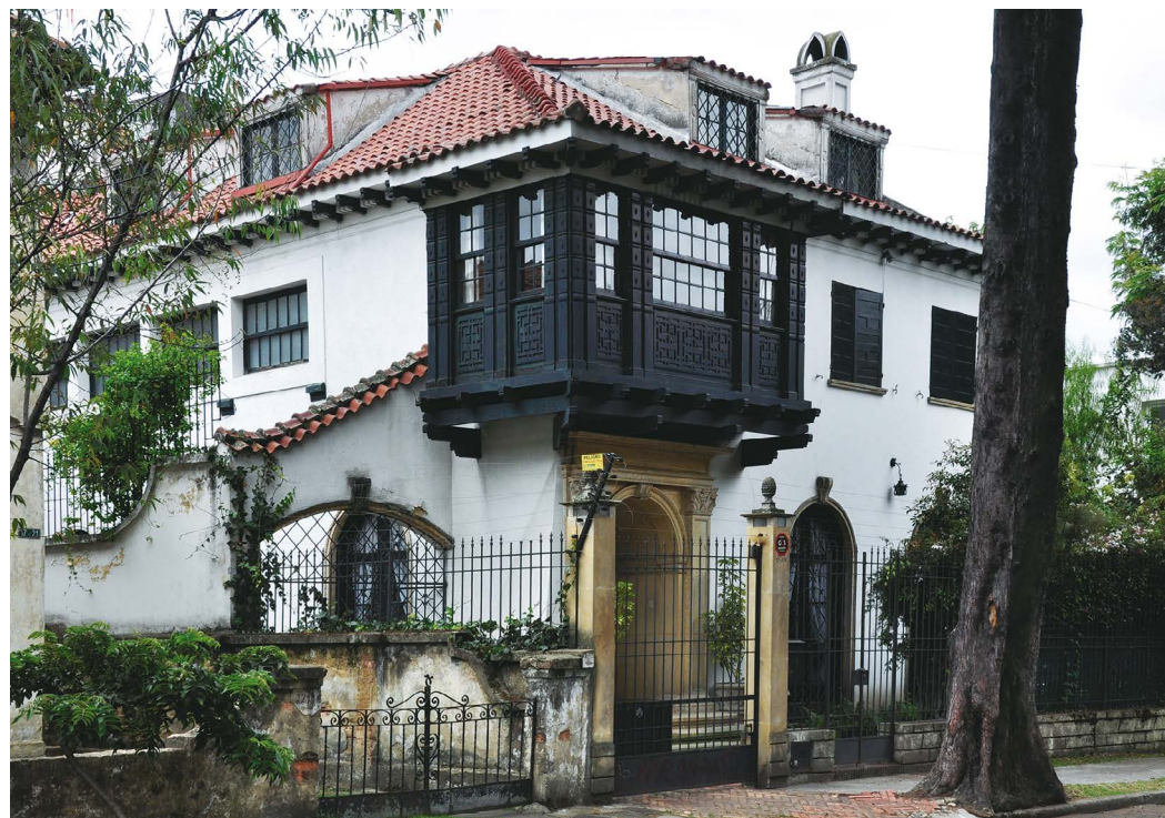
▲ Figura 3. Barrio La Magdalena, Bogotá

Para los dos primeros ejes no hay asignadas variables de análisis. Para los dos últimos, las variables están en relación con las características que presentan las unidades: fuerza visual, perturbación visual, cambios y mutaciones, dinámicas o tendencias detectables, coherencia paisajística, actuaciones y evoluciones.