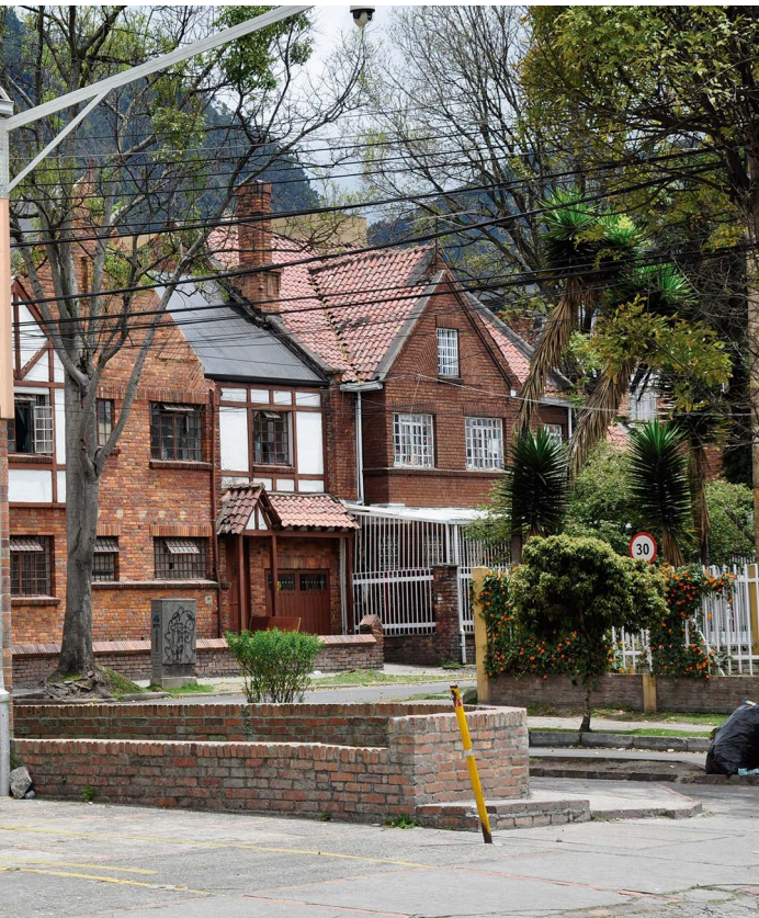
▲ Figura 1. Barrio La Magdalena, Bogotá