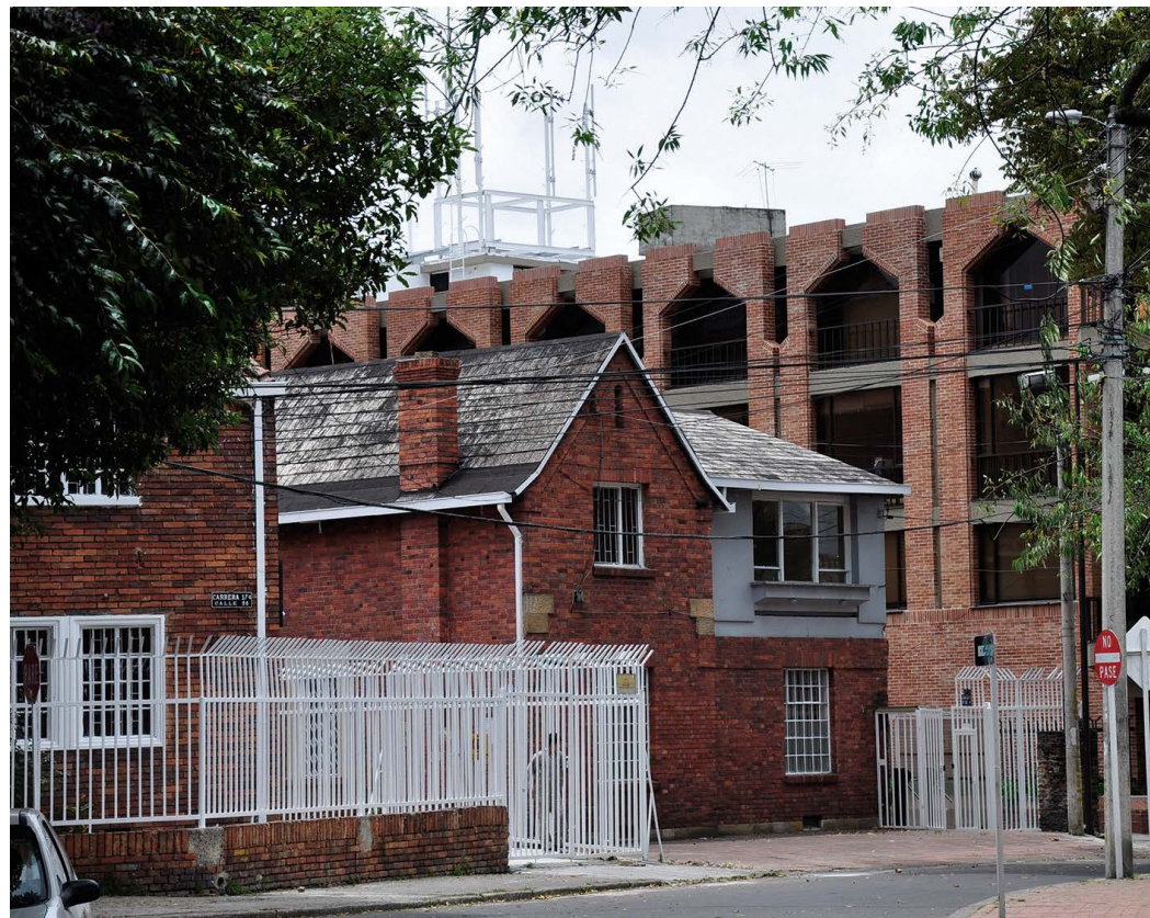
▲ Figura 2. Barrio La Magdalena, Bogotá

con las características morfológicas y la estructura visual para el contexto geográfico y para las unidades de paisaje: la cuenca visual, los ángulos de visión, la distancia y los tipos de paisaje de acuerdo con su grado de antropización. Todos estos componentes y sus indicadores 8 apuntan a reconocer el paisaje en tanto forma, composición y grados de antropización para las áreas naturales.