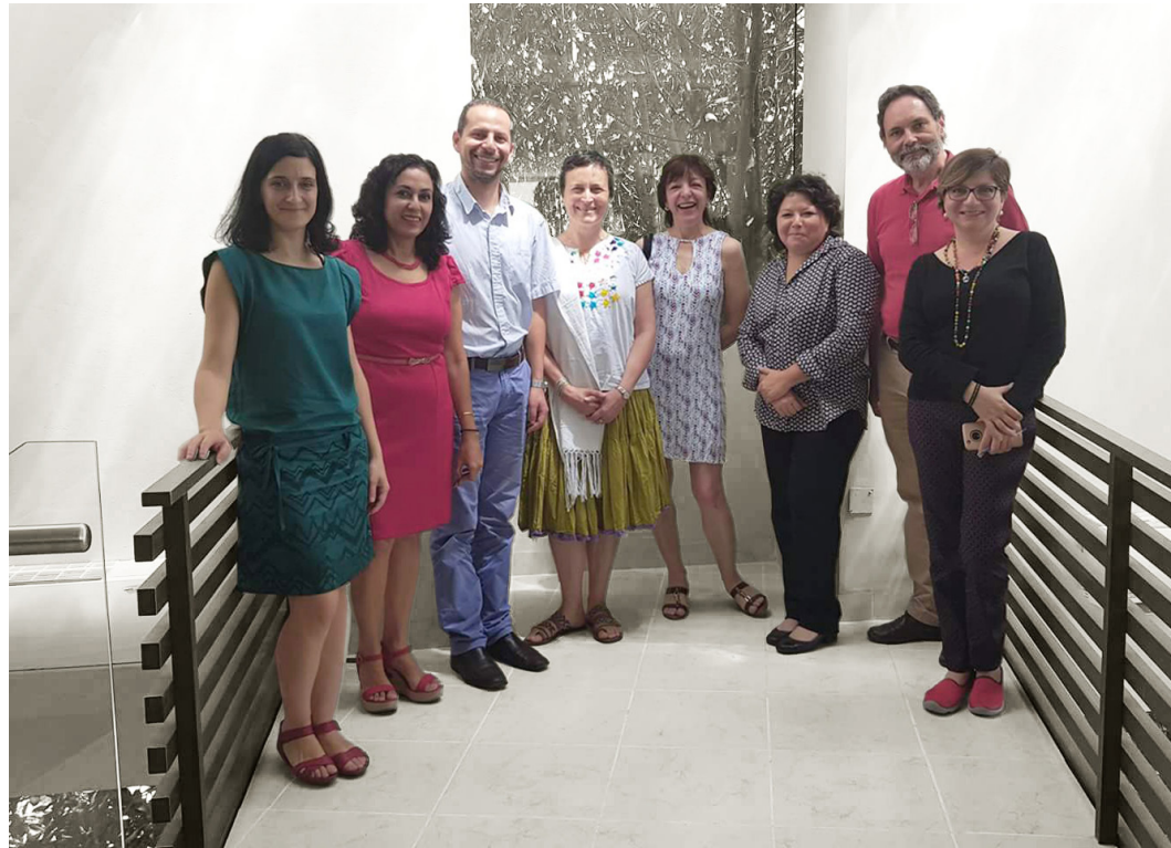
Figura 1. Editores, ponentes y participantes en el III Encuentro de Editores de la Asociación Latinoamericana de Revistas de Arquitectura (ARLA)