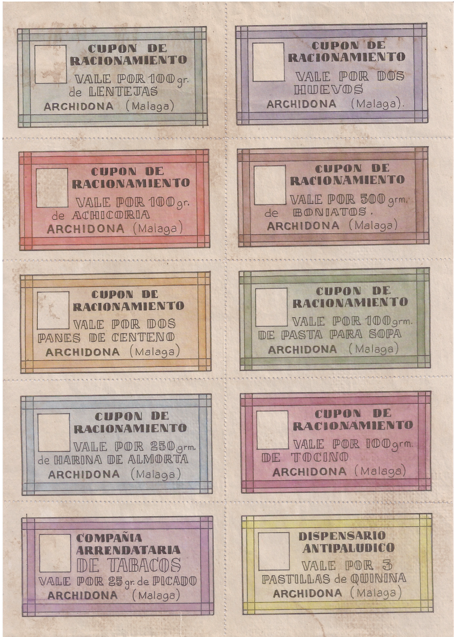
Estos cupones de racionamiento nunca llegaron a circular durante la Guerra Civil. Adquiridos en Librería Anticuaria "Galgo", de Ribadeo (Lugo).