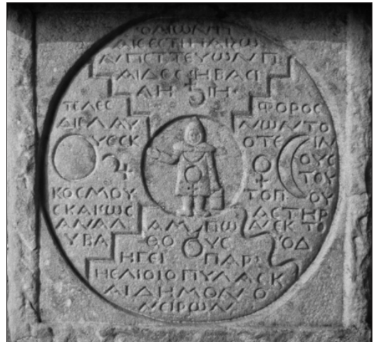
Figura 4. Relieve de Filemón. https://upload.wikimedia.org/wikipedia/commons/thumb/b/b2/Bollingen_lapis1.jpg/1238px-Bollingen_lapis1.jpg

compartiría “con otros dominios cósmicos, mundos siderales que ejercen su actividad sobre el cuerpo astral incluso durante la vigilia”. I. Más (29) siguiendo a Rudolf Steiner afirma como existiría “una relación entre aquella parte del