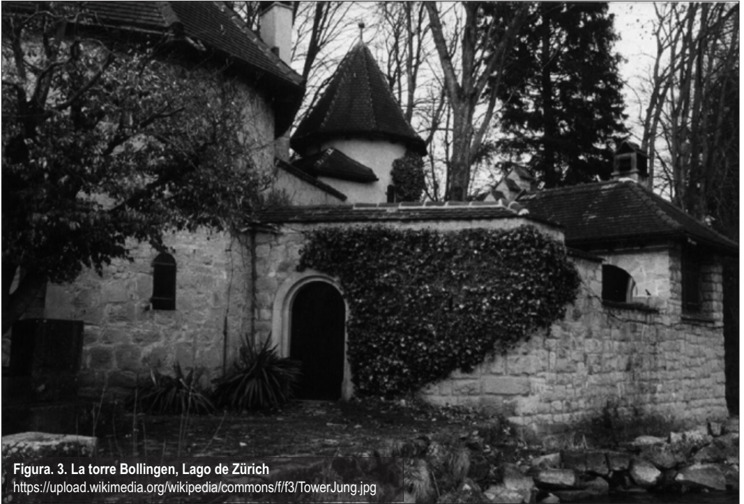
Figura 3. La torre Bollingen, Lago de Zürich https://upload.wikimedia.org/wikipedia/commons/ff/f3/TowerJung.jpg

de nacer. Por eso, cuando se vuelve a la vigilia, aparecen renovados los pactos con la vida y asoma la rebeldía a seguir siendo esclavo de situaciones creadas”.