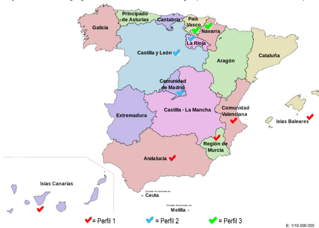
Mapa 1- Distribución geográfica de los casos de estudio según perfil socioeducativo de estudio. España.