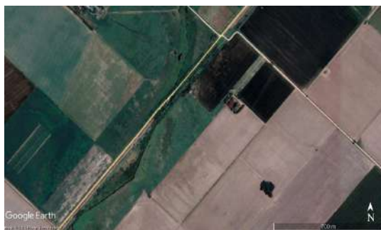
Figura 6. Área de desbordes (Google Earth, 2019)

Sin embargo, no se ha obtenido la mejor respuesta a la acción tomada ya que también se requiere la realización de acciones sobre la alcantarilla ferroviaria y sobre la vegetación arbórea.