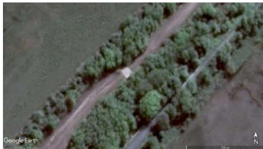
Figura 5. Detalle de alcantarilla

urbanas y además son propiciados por los propietarios de aguas abajo a quienes benefician por su control sobre los escurrimientos.