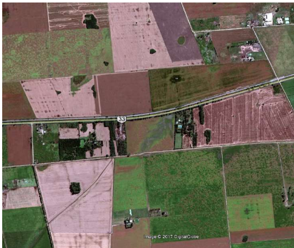
Figura 3. Interrupción de una línea de escurrimiento (Google Earth, 22/03/2010)

No solamente para los de los lotes ubicados inmediatamente aguas abajo de la barrera sino para todos aquellos ubicados hacia aguas abajo en la línea de escurrimiento, la idea de modificar esta situación es impensable e inadmisibles.