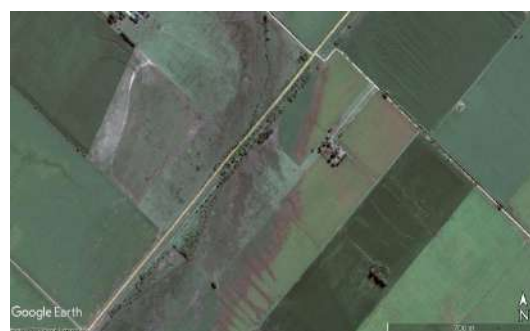
Figura 4. Área de desbordes

extiende hacia el noreste dirigiéndose hacia la localidad de Rueda.