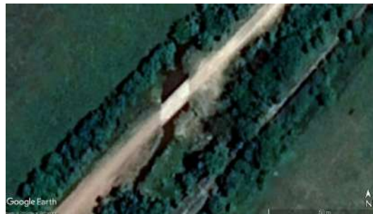
Figura 7. Detalle de alcantarilla (Google Earth, 2019)

las entidades de control público así como de la toma de medidas correctivas en cada uno de los proyectos de obra que se requieran.