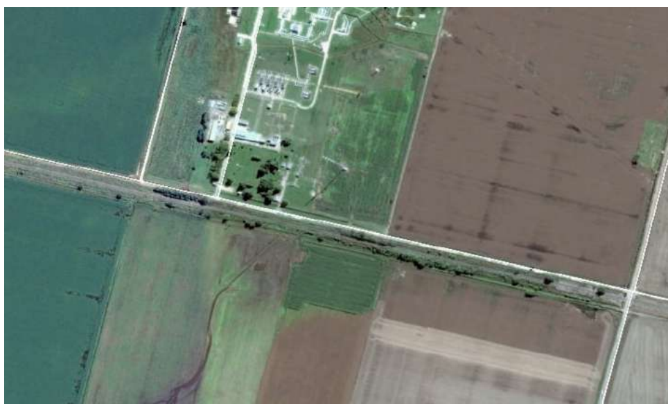
Figura 2. Alcantarilla en imagen satelital actual (Google Earth, 27/02/2016 – 04/05/2017)