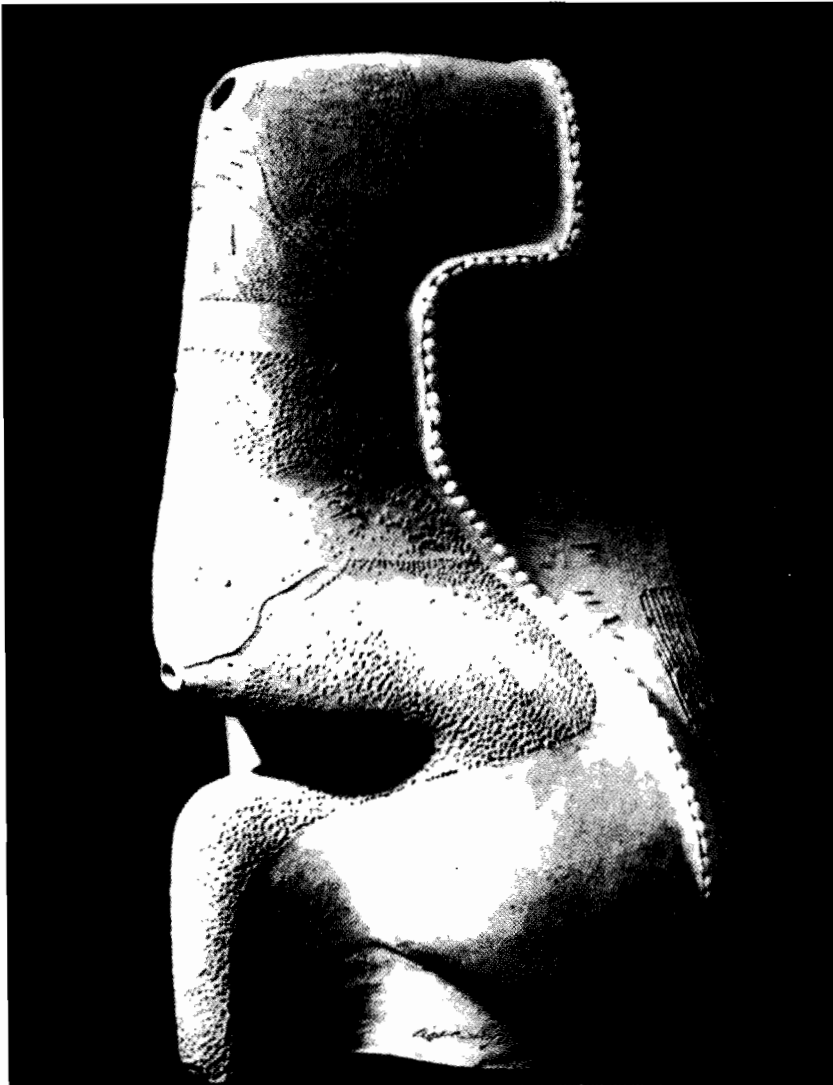
Arquitectura. Arcadio Blasco.

Una importante retrospectiva de Luis Sáez (MBAA, mayo), a partir de las obras informalistas realizadas hacia 1960, puso de manifiesto la directriz próxima a un expresionismo surrealista de su pintura. La paulatina incorporación, durante los años sesenta, de referencias a lo real, culmina, en el decenio siguiente, en violentas iconografías de vísceras y cuerpos sufrientes, para aquietarse, en las pinturas posteriores a 1978, en una atmósfera en donde estáticos objetos que parecen inspirados en el mundo de Holbein han sustituido a los desgarrados torsos femeninos.