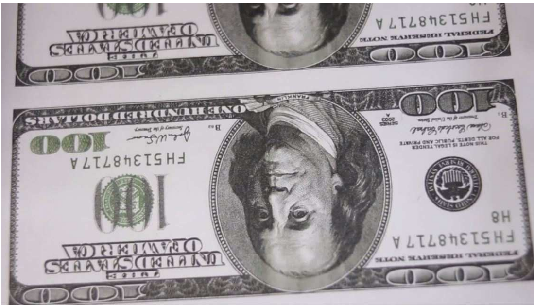
Un billete bajo una disposición visual no convencional como efecto de clausura del relato.

O también la imagen que cierra la película. Al final Mauro se convierte en falsificador, pero como una pieza más en un engranaje que nada tiene que ver con la organización en “células” que fantaseaba liderar, conformada por distintos grupos de reclutadores, organizadores, papeleros, “pasadores”, etc. que usan nombres falsos y no se conocen entre sí y que viajan en temporada a las localidades veraniegas para montar todo como si fuera un “teatro” allí donde está la gente. Regida por un nuevo régimen de producción profesionalizado, la falsificación de dinero ya no es parte de un ritual artesanal en sesiones caseras entre amigos, sino de un proceso mecánico de fabricación en serie, un trabajo organizado en un taller con cierta infraestructura, maquinaria y empleados; un cambio de escala del “negocio” del que es representativa la nueva especie monetaria a copiar, ya no billetes de veinte pesos sino planchas de cien dólares. La última imagen del film muestra un recorte de una de estas planchas arrojadas por una máquina. El encuadre queda cubierto en su totalidad por un billete más un tercio de otro ubicados en posición invertida, una disposición visual no convencional que produce una perturbación de la mirada como efecto de clausura del relato.