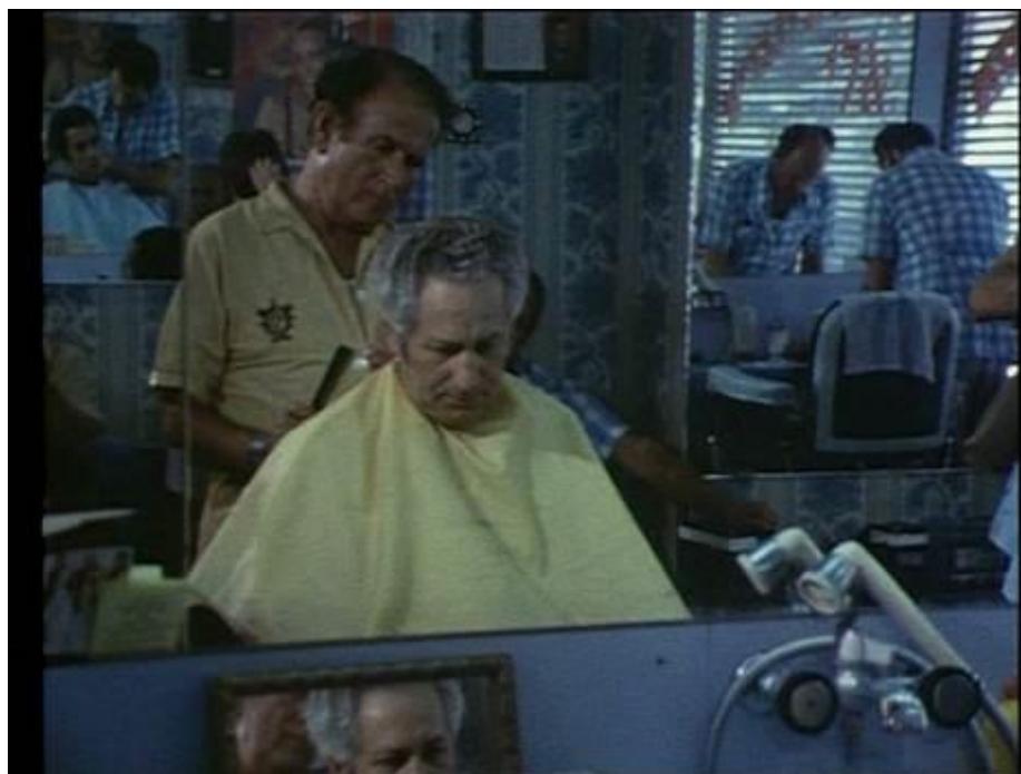
Fotograma de Shoah (Claude Lanzmann, 1985)

¿Cuáles son las formas y los límites de la representación fílmica del Holocausto? El problema de la visibilidad del sufrimiento extremo compromete el debate sobre las dificultades de la representación, desde posiciones que reclaman la necesidad de mostrar imágenes del horror, como exponen desde distintos ángulos Jacques Rancière, Didi-Huberman, Agamben, Jean-Luc Nancy, hasta autores, como Gérard Wajcman, que postulan la interdicción de la representación a causa de lo indecible y por eso mismo irrepresentable del exterminio. A partir de esta discusión, el capítulo siguiente, “Campos y memoria. Una aproximación a Shoah (Claude Lanzmann, 1985)”, desanda la relación estrecha entre ética y estética que impone la memoria del Holocausto para asumir el “vínculo inescindible entre los recuerdos, el modo en que se perciben y la forma en que se procesan y representan para construir una identidad individual y una comunitaria” (p. 282). Pese a que Lanzmann no muestre cámaras de gas ni escenas de exterminio, su documental constituye un auténtico archivo audiovisual sobre el testimonio de sobrevivientes de diversos campos: no sólo pone en imagen el valor del testimonio, sino que