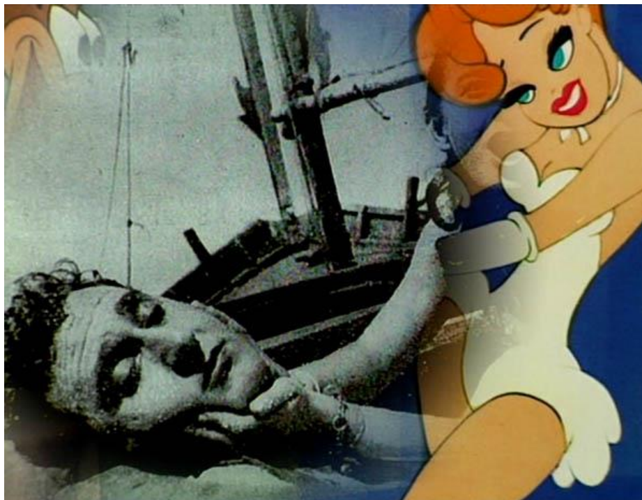
Fotograma de Histoire(s) du cinéma (Jean Luc-Godard, 1988-1988)