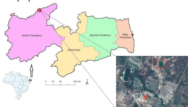
Figura 1. Localização do município de Catolé do Rocha- PB e vista área parcial da Fazenda Cajueiro (UEPB), com destaque para o local de coleta dos anfíbios anuros.

foram capturados açude da Fazenda, que apresentou água durante todo o período de estudo. A vegetação em torno do corpo hídrico é representada por caatinga arbóreo-arbustiva além da presença de gramíneas e solo arenoso com presença de rochas.