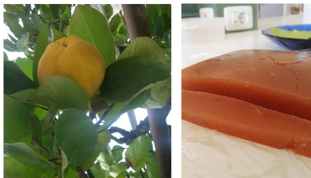
Figura 3. (Izquierda) Membrillo natural ( Cydonia oblonga ). (Derecha) Producto final elaborado: dulce de membrillo

Después de seis días de almacenado en el frigorífico a 2,5 °C, se sacó del molde de polipropileno y se cortó en trozos de tamaño adecuado para ser comidos de un solo bocado (Figura 3, derecha). La primera degustación fue realizada por el grupo de trabajo y una vez comprobado que estaba en su punto adecuado de textura y sabor se procedió a emplatarse. Para hacer más agradable la presentación de nuestro producto, el grupo fue a un supermercado para buscar algún otro alimento que pudiera acom-