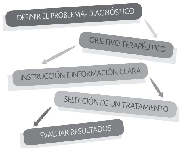
Figura 2. Terapéutica razonada.

Para seleccionar medicamentos con base en la terapéutica razonada, se debe seguir una secuencia de pasos que van desde la definición a través de la valoración del paciente, siguen con la comprensión de cuál es el objetivo terapéutico correcto, continúan con la selección de tratamientos tanto médicos, fisioterapéuticos y procedimentales, se plasman en la instrucción y desarrollo de prescripciones correctas y finalizan con la evaluación de los resultados terapéuticos. Todos estos pasos son productos de la evaluación clínica constante. (Figura 2)