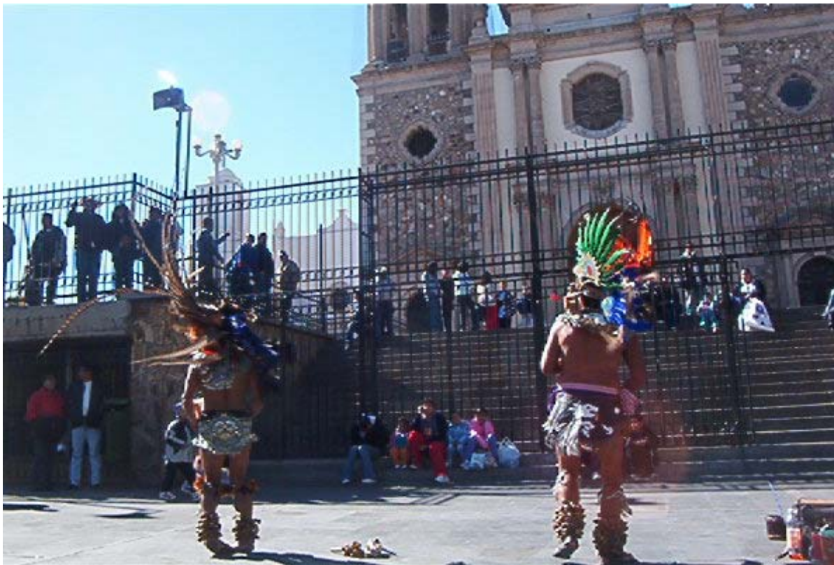
Danza de Matachines. Centro de Ciudad Juárez.

Hodson WK. Manual del Ingeniero Industrial , Mex.: Mc Graw Hill, 2001, pgs. 4.15-4.18