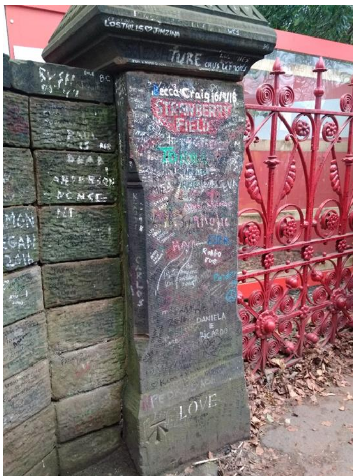
Figura 7. Entrada de Strawberry Field durante la remodelación del sitio, Liverpool.

finalmente sustituido por una placa embebida en el muro para evitar las continuas sustracciones por parte de los visitantes).