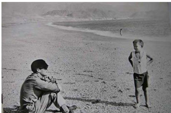
Figura 1. Una conocida foto del músico en la playa de Carboneras.

3. LA(S) MEMORIA(S) DE LENNON. Pero la más profunda huella de la estancia de John Lennon en Almería tiene forma de canción: Strawberry Fields Forever . Alejado temporalmente del torbellino que había sido hasta ese momento su vida, probablemente motivado por un ambiente tan radicalmente distinto a todo lo anteriormente conocido por él, rodeado por el desierto y por una vida social tradicional y provinciana, es probable que no le quedase más remedio que ejercer la introspección. Y ésta le confrontó con un estado de ánimo en el que predominaban la incertidumbre y la confusión, que compartía con sus colegas de banda y que había contribuido, precisamente, a que aceptase la oferta de Lester. Este proceso introspectivo le condujo, al parecer, a rememorar un rincón de su niñez, al que acudía a jugar con sus amigos: el jardín de una sede del Ejército de Salvación llamado Strawberry Field . 6