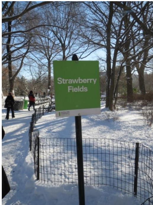
Figura 5. Strawberry Fields, en Central Park, Nueva York.

Se puede trazar un hilo (casi) invisible, entonces, entre dos lugares reales de los cuales, sin la evocación de Lennon, el primero apenas sería conocido por más personas que las directa y biográficamente relacionadas con el mismo. Y el segundo probablemente ni siquiera existiría como tal lugar (como espacio delimitado y socialmente identificado en el tiempo, dentro del conjunto de Central Park, a través de un topónimo) si no existiese Strawberry Fields Forever , y si Lennon no hubiese sido asesinado en el portal de su edificio (esto es una hipótesis).