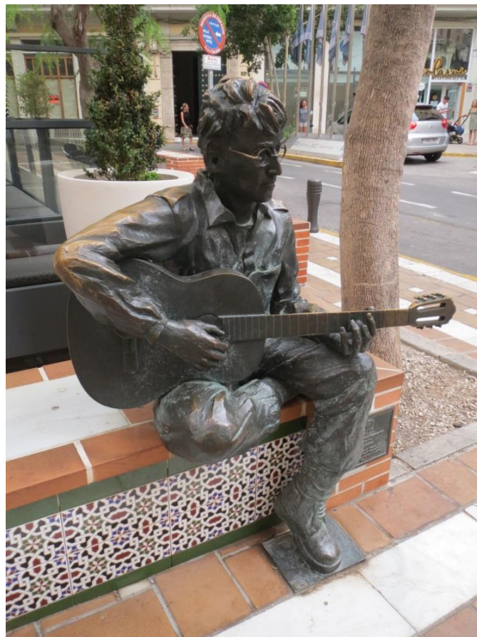
Figura 6. Escultura de John Lennon en la Plaza de las Flores, Almería.