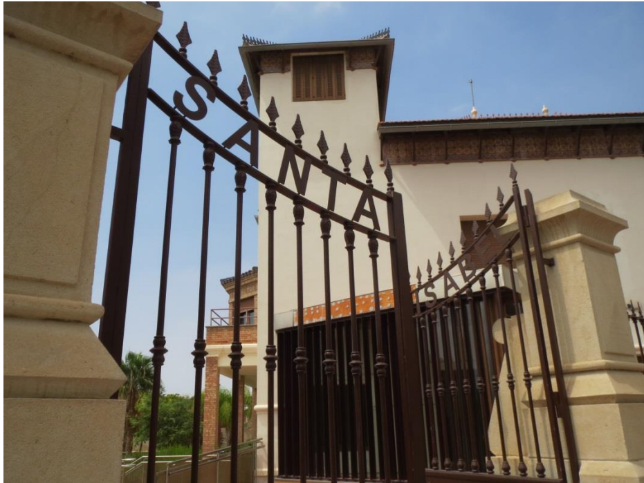
Figura 2. La verja de la Finca Santa Isabel, hoy convertida en Casa del Cine.

Uno de los mayores iconos de la década prodigiosa, la década que quiso cambiar el mundo, en un rincón desértico de la Europa periférica, casi en África, a sus veintiséis años, se acordaba de su niñez. Se puede decir que en él hizo presa un sentimiento que en esa época, y a su edad, no parecía muy común (o, al menos, no era un tema frecuentado en el ámbito artístico): la nostalgia. Los versos de Strawberry Fields Forever , aunque rodeados de una abundante “decoración musical” (Hertsgaard, 1995, p. 192), teñidos de surrealismo, impregnados de ácido lisérgico y fiel reflejo de su estado de incertidumbre, así parecen revelar 9 El mismo adverbio que completa el título recalca este sentimiento, al perpetuar en el tiempo ( forever ) un recuerdo de la infancia.