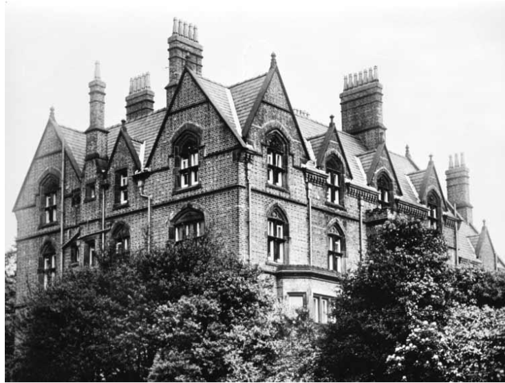
Figura 4. El edificio de Strawberry Field en 1967.

demasiado en los valores culturales asociados a éstos, ni en el potencial económico de su fosilización .