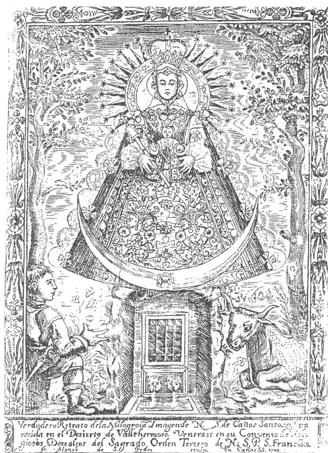
1. GRABADO DE LA VIRGEN DE CAÑOS SANTOS, FECHADO EN 1710, INCLUIDO EN LA OBRA DE FRANCISCO DE VALDIVIA HISTORIA, VIDA Y MARTYRIOS DEL GLORIOSO ESPAÑOL SAN ARCADIO URSANENSE , EDITADO EN CÓRDOBA EN 1711.