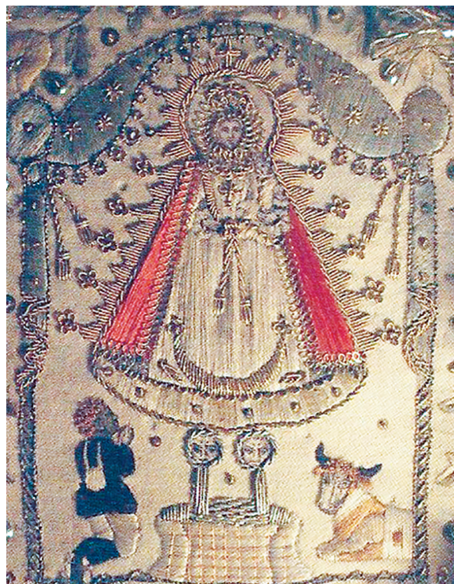
2. BORDADO DE LA VIRGEN DE CAÑOS SANTOS (SIGLO XVIII). COLECCIÓN PARTICULAR.