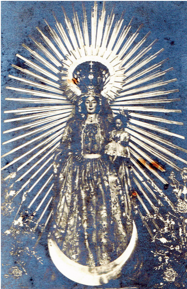
3. VIRGEN DE CONSOLACIÓN DE OSUNA.