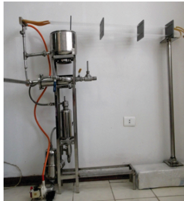
Figura 3. Fotobiorreactor multitubular estático con Sistema de recirculación continuo del medio líquido.