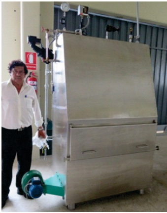
Figura 1. Caldera para combustión.

a nivel piloto empleando el fotobiorreactor tubular compuesto de 20 tubos de 1,0 cm de diámetro y 1,22 m de longitud, donde se colocó el cultivo, mientras que el medio líquido depositado en un recipiente de 4L fue bombeado al mezclador líquido-gas con ingreso directo de gases de combustión de la caldera previamente enfriados y pasar a la torre de absorción para la captura de \text{CO}_2 por el líquido de cultivo, depositándose en el recipiente inferior para ser recirculado continuamente hacia el fotobiorreactor mediante una bomba centrífuga. Los parámetros de diseño del fotobiorreactor tubular múltiple se determinaron en función de la capacidad de la caldera de biomasa de pellets de tara.