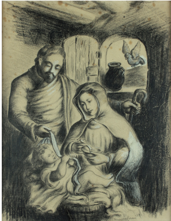
Figura 6: Escena natalenca [ Sagrada Família ] (1937), llapis al carbó i aquarel·la sobre paper de 28,5 x 22,5 cm. / Font: Comprada a l'antiquari Daniel Román