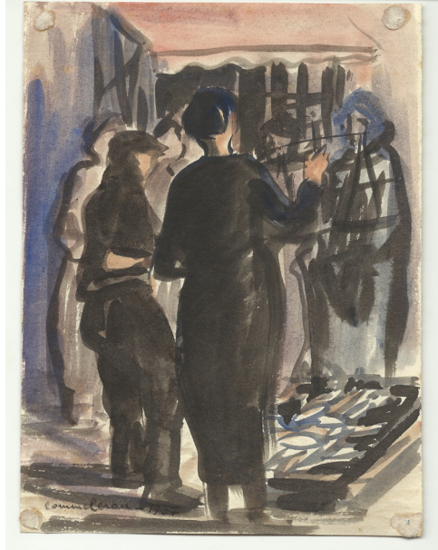
Figura 1: Pescateria (1937), tinta, aquarel·la i aiguada sobre un paper de 22,2 x 32,5 cm