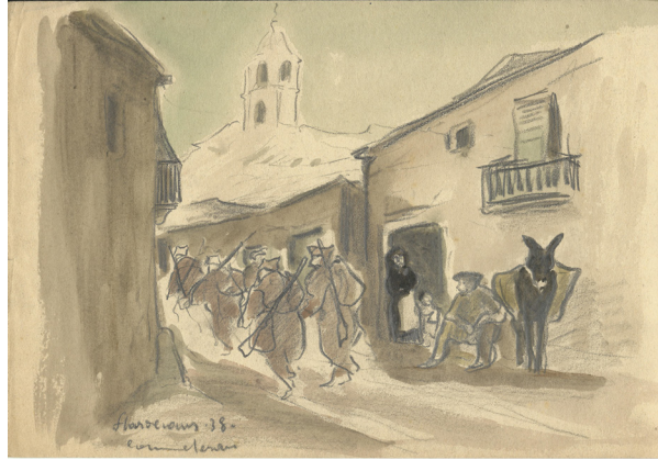
Figura 3: Llardecans (1938), tinta, aquarel·la i aiguada sobre un paper de 22,2 x 32,5 cm

Vull destacar un dibuix molt significatiu de Commeleran, que hem rescatat, on representa la marxa d'uns soldats en retirada per un carrer de Llardecans 15 en 1938 (fig. 3). És una composició equilibrada, amb el campanar de l'església del poble al fons del carrer per on desfilen els soldats, la marxa dels quals es observa per un camperol d'edat avançada assegut al costat de la portalada de casa, on hi ha una velleta amb un nen petit contemplant també el pas dels homes armats. Al costat del vell assegut, hi ha dibuixat un burret català negre amb l'albarda. Si fem predominar una visió bèl·lica de l'obra, podem titular-la La 44 Divisió a Llardecans (1938), perquè l'abril de 1938 la 44 Divisió de l'Exèrcit Popular de la República es va concentrar a Llardecans 16 després d'haver abandonat Lleida ocupada per les tropes franquistes (Engel, 2005: 305); però Commeleran la va titular Llardecans (1938), perquè va fer una representació fonamentalment civil de l'escena.