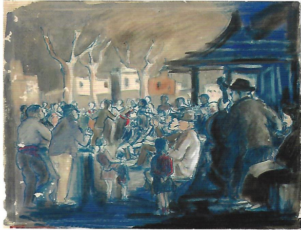
Figura 2: Marinada (1937), tinta i aquarel·la sobre paper de fil de 25 x 32 cm.

El dibuix (fig. 2) és un testimoni visual de l'actuació de l'Orfeó Català del mestre Millet [Lluís Millet Pagès (el Masnou, 1867 – Barcelona, 1941)], que va executar la sardana Marinada del músic valencià Antoni Pérez Moya (València, 1884 – Barcelona, 1964) acompanyat per la Cobla Barcelona AM, la interpretació de la qual va dirigir el mateix Antoni Pérez Moya. La van ballar les colles de sardanistes "Florida" de Foment de la Sardana i "Roses i clavells" de de l'Agrupació Sardanista. El testimoni gràfic de la celebració que ens ha llegat Commeleran és un document de primera magnitud, no solament per la representació animada de la cobla, el públic i els sardanistes, sinó pel paisatge urbà amb els arbres, les cases i l'edifici que ens recorda l'ermita de Santa Madrona al fons de l'escena. I sobretot pels diversos personatges representants. Crida l'atenció, en una escena d'alegria, on tots contemplen el ball i escolten els músics, la figura fosca d'una dona trista i mentalment absent del panorama festiu. Està en primer terme a la dreta de l'escena. Va vestida de cap a peus amb roba negra, amb un davantal i un mocador que li cobreix els cabells.