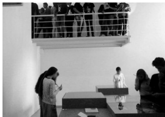
Figura 6- Alunos na exposição de artes no MUnA.