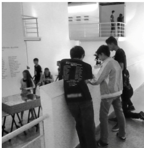
Figura 5- Alunos na exposição de artes no MUnA.

Em sintonia com as figuras 3 e 4, as figuras 5 e 6 mostram outros momentos da aula de campo desenvolvida no MUnA: