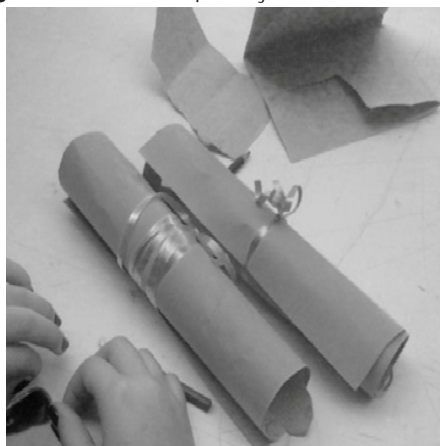
Figura 8- Alunos na produção artística no MUnA.