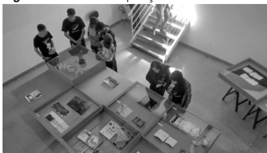
Figura 1- Alunos na exposição de artes no MUnA.

sobre como seria a aula de campo e as atividades realizadas naquele dia. Uma professora do curso de Artes Visuais da UFU e monitores do museu se encarregaram de informar aos alunos, exercendo o papel de mediadores. Em seguida, os estudantes foram encaminhados para ver as exposições que ocorriam nessa instituição, os quais ficaram surpresos com as obras de arte contemporâneas presentes, como podem ser vistos nas figuras 1 e 2: