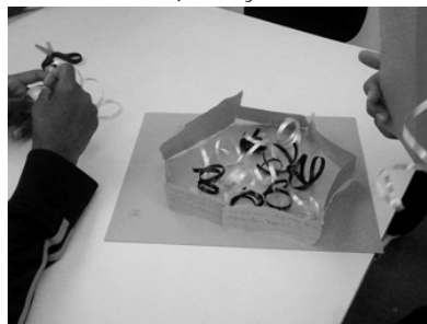
Figura 4- Alunos na produção artística no MUnA.