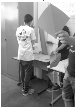
Figura 7- Alunos na produção artística no MUnA.