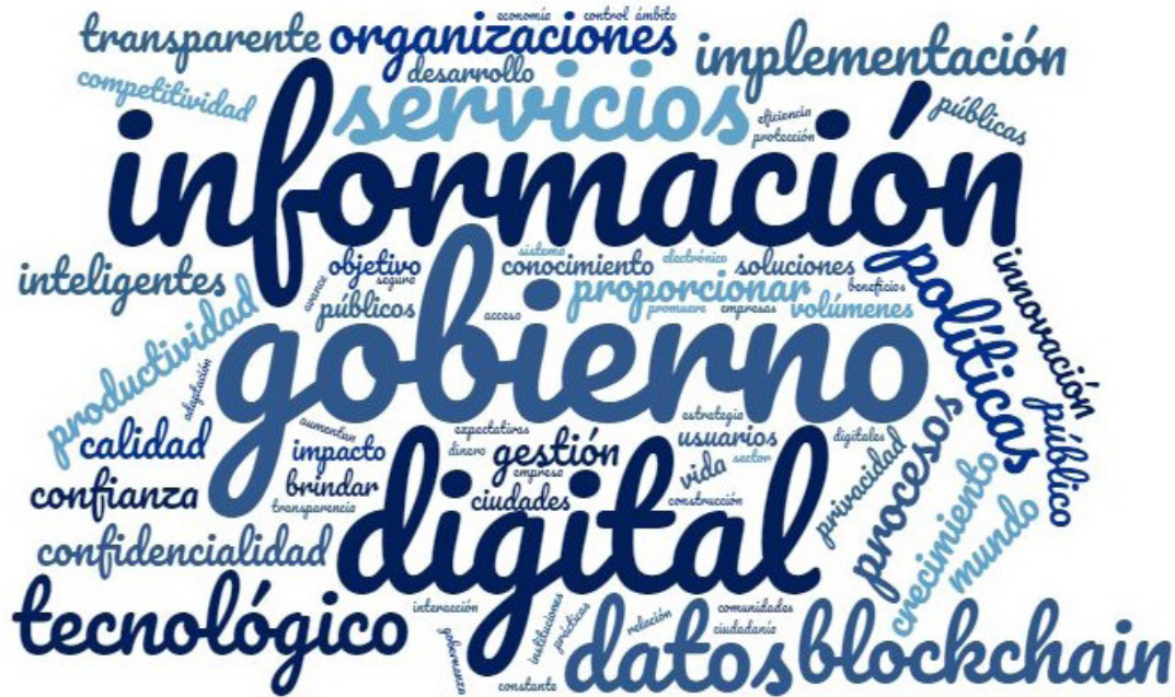
Figura 3. Nube de palabras principales de los documentos revisados