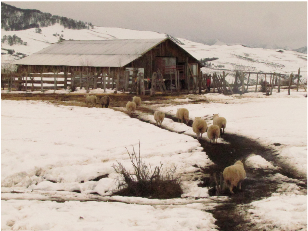
Figura 2 Animales menores en la invernada.

un total de 60 (Figura 2). Sin embargo, no es posible establecer un número exacto de animales; según estadísticas del Servicio Agrícola y Ganadero (SAG), el total de animales rondaría las 2000 cabezas en este año. En cuanto al tiempo que tarda el trayecto hasta los lugares de pastoreo, desde el inicio de la veranada hasta los puntos más lejanos en Laguna Escondida y Piedra Sinchona alcanzan los 23 y 25 kilómetros respectivamente, para lo cual los animales grandes pueden demorar un día de ruta y los animales pequeños dos días.