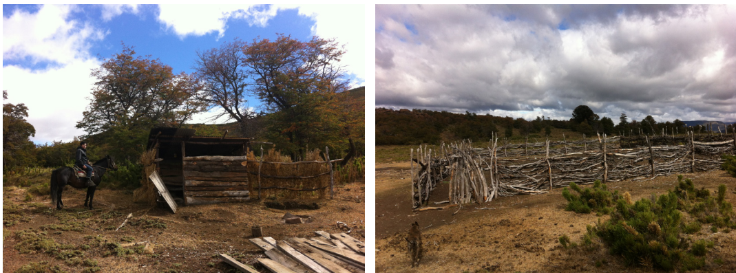
Figura 1 Puesto de veraneo y corral para animales.

El resto de los miembros de la comunidad lo hace entre diciembre y enero. Lo anterior se debe a que los puestos más alejados se encuentran a mayor altura (entre los 1300 a 1700 msnm) y que, en condiciones climáticas normales, la nieve no permite establecerse en los puntos de pastoreo tempranamente. El período de veraneo dura entre 4 a 6 meses. El inicio de la invernada en Pehuenco está marcada por las primeras heladas del año, por lo tanto, este es un indicador para el inicio del arreo de animales hacia las partes bajas del valle, lo que ocurre entre fines de marzo y mayo.