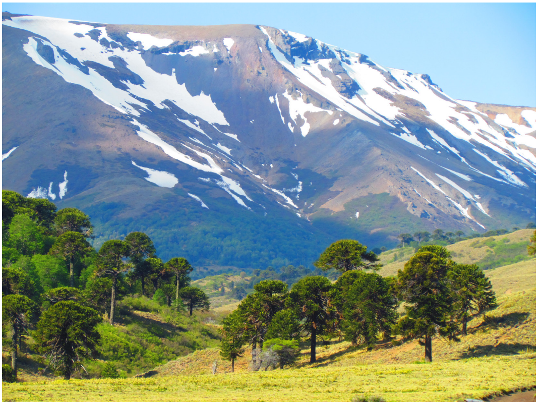
Figura 3 Pinalerías o bosques de Araucaria.

“Se piñonea en la pampa Cayulafquén, es una pampa, una meseta en donde salen muchos piñones, eso es algo que no se ha perdido, que después lleguen todos en común y se recojan los piñones en las veranadas, ahí están todos igual unidos. Pero casi todos tienen, ya, cada uno sabe hasta dónde llega su campo ¿cierto?. Y ahí piñonean...y hay algunos que no tienen pinos. Entonces ese es el problema, todavía hay una consideración que de repente, que el que tiene pino al que no tiene pino, le convida al vecino”.