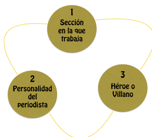
Figura 1: Esferas en las que se dividen las funciones.

Las 21 funciones se distribuyen en tres esferas. Primera esfera: según la sección en la que desempeña su profesión. Segunda esfera: según la personalidad del periodista. Tercera esfera: según se consideren héroes o villanos.