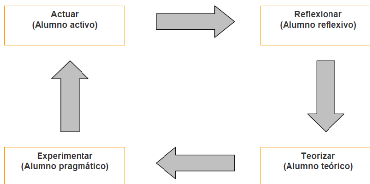
Figura 2. Fases del aprendizaje según el modelo de Kolb.

Las fases del aprendizaje óptimo se aprecian en la figura 2.