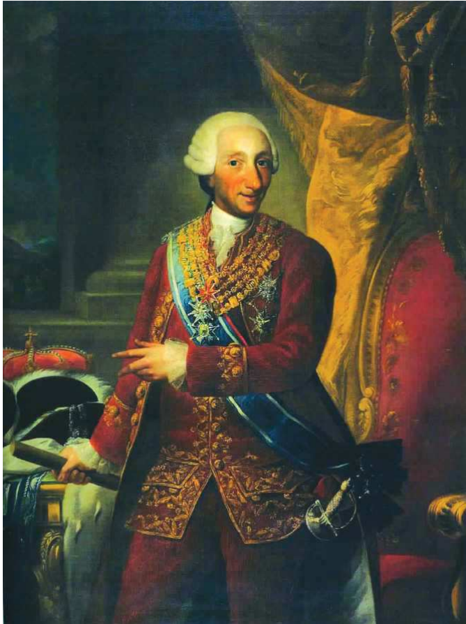
[ILUSTRACIÓN 1] Ginés Andrés de Aguirre, Carlos III, 1784/1786, 243 x 208 cm. Colección particular.

pastores y dos peregrinos (óleo sobre lienzo, ambos de 67,3 x 47,7 cm), ejecutados por Ginés Andrés de Aguirre, bajo la dirección y modelos del valenciano, con destino a la decoración de la pieza de vestir -finalmente situados en la pieza de los relojes- del cuarto del príncipe de Asturias en el palacio del Pardo en Madrid 12 . Volverían a aparecer en la misma casa en fechas más recientes, ya atribuidos acertadamente a Ginés Andrés de Aguirre 13 .