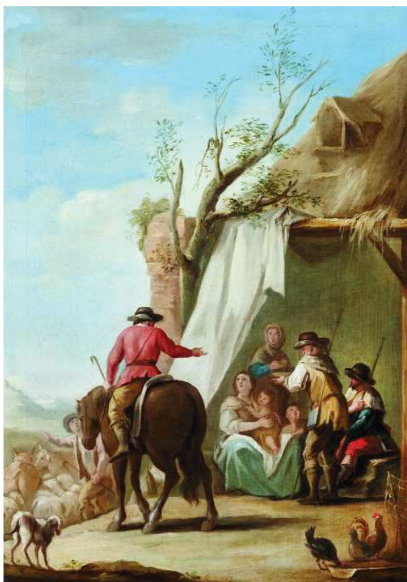
[ILUSTRACIÓN 3] Ginés Andrés de Aguirre, Una cabaña de pastores y dos peregrinos , 1777, 67,3 x 47,7 cm. Colección particular.

Más información se puede sustraer de Una cabaña de pastores y dos peregrinos [ILUSTRACIÓN 3], ya que, como se ha comentado, se conserva su dibujo preparatorio. En cuanto al diseño, mantiene el formato hacia la vertical -estructurando de forma definitiva la cabaña de los pastores-, el deshojado