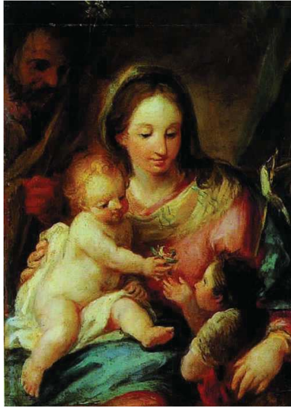
[ILUSTRACIÓN 4] Ginés Andrés de Aguirre, Sagrada familia con san Juanito, h. 1777, 36 x 26,5 cm. Colección particular.

de Santa Bárbara de la catedral de Segovia (1777, óleo sobre lienzo, 102 x 73 cm), es obra que se suma al catálogo del pintor murciano.