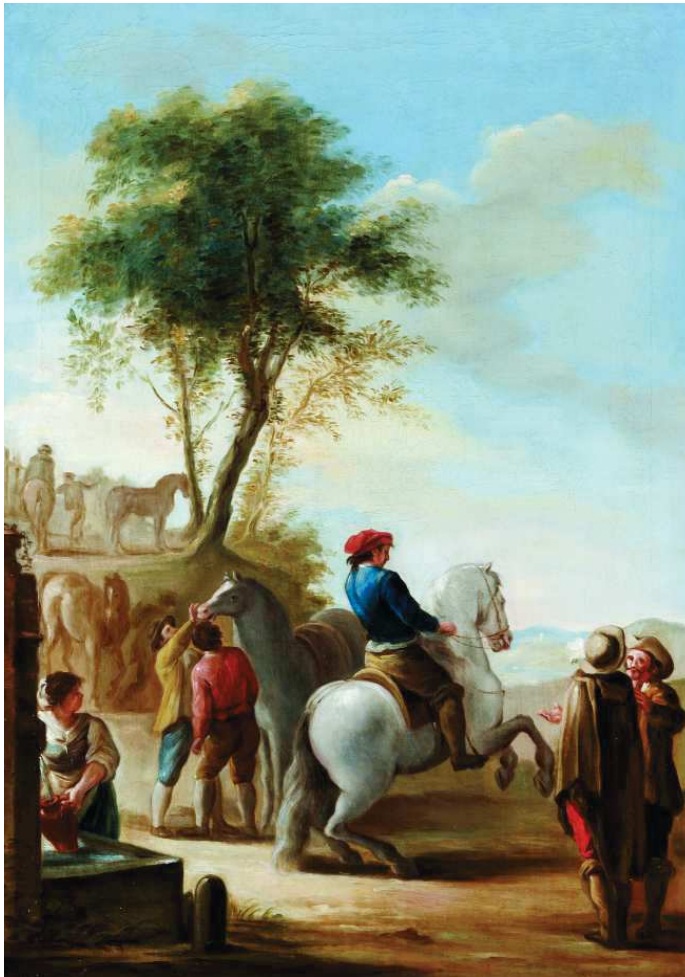
[ILUSTRACIÓN 2] Ginés Andrés de Aguirre, Mercado de caballos, 1777, 67,3 x 47,7 cm. Colección particular.

maleza y roca viva en el cuadro final. El mariscal y el dueño que miran la boca al equino, poseen un canon más alargado, que después mejorará al acortar la estatura del personaje vestido de carmín; también mejoraría la posición del ojo del caballo, muy bajo en el boceto y correctamente situado en su reproducción final, abriendo la posición de sus cuartos delanteros, lo que le aporta una mayor estabilidad. Modificaciones que también presentan la figura central, de mayor tamaño en la pintura preparatoria, y el caballo, con variaciones en la cabeza, las patas y la cola, que, en este caso, se prefieren a la obra final. También cambiaría la postura de los dos caballeros situados en