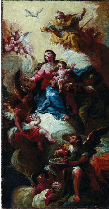
[ILUSTRACIÓN 5] Ginés Andrés de Aguirre, Coronación de la Virgen, 1783/1784, 65,5 x 45 cm. Colección particular.

de Talavera de la Reina en Toledo, cuya réplica se conserva en la Embajada de España en Lima por depósito del Museo Nacional del Prado (P0872, óleo sobre lienzo, 134 x 73 cm), o la Inmaculada Concepción que pintó para una de las capillas radiales de la basílica de San Francisco el Grande de Madrid (óleo sobre lienzo, 742 x 370 cm), ambas realizadas entre 1783 y 1784; fechas en las que también se debe de situar la obra. Hay que señalar que en las representaciones de la Coronación de la Virgen es común que al lado de Dios padre y del Espíritu santo, se sitúe la figura de Cristo triunfante -portando o no la cruz-, sujetando entre ambos la corona. Aquí, sin embargo, Cristo se representa como Niño en el regazo de la Virgen.