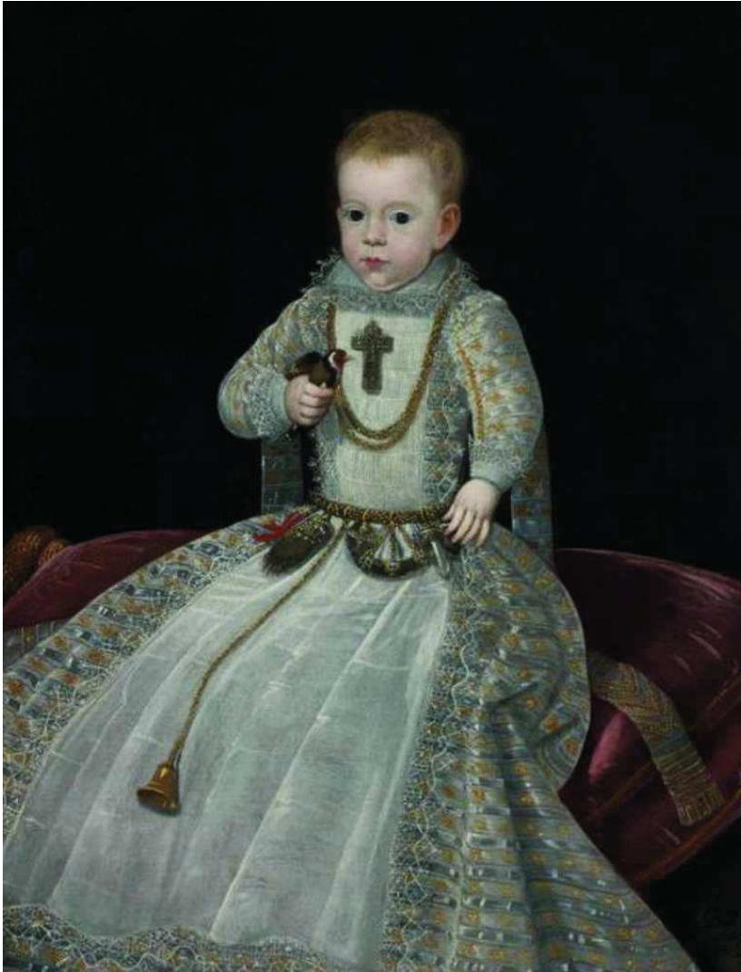
Bartolomé González ¿ Retrato del Infante don Fernando de Austria? (Museo de Bellas Artes, Budapest).

Existe una cédula real 62 en la que se refleja el encargo de ocho retratos a González que se enviaron a Polonia en agosto de 1618 y en ella se dice que todos son de la misma medida, de dos varas y media de alto y vara y cuarta de ancho (208x105 cm). Estos retratos se hicieron seguramente queriendo