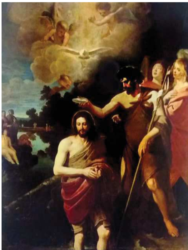
Gaspar de Crayer, Bautismo de Cristo , Descalzas Reales de Madrid.