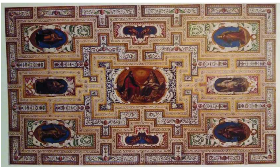
Vicente Carducho, Monasterio de la Encarnación, techo del relicario.

Hizo el techo del relicario del monasterio de la Encarnación de Madrid, en 1617-1618 42 . Está pintado al temple y tiene un óvalo en el centro representando la Trinidad , rodeado de ángeles, con seis santas vírgenes 43 en reservas ovaladas, todo ello encuadrado en motivos fingidos en la línea del gusto italiano de mediados del siglo XVI.