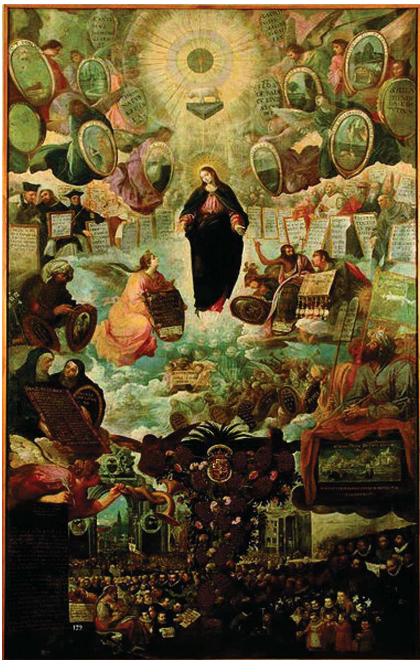
Juan de Roelas, Alegoría de la Virgen Inmaculada , 1616, Museo Nacional de Escultura de Valladolid.

TORNOS ARROYO, Mónica, «Pintores y pintura madrileña en 1618», Anales del Instituto de Estudios Madrileños (Madrid), LVIII (2018), págs. 341-376.