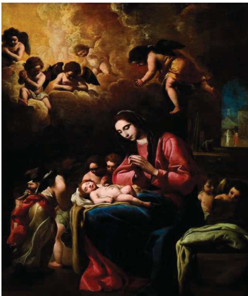
Eugenio Cajés, Virgen con el Niño y ángeles (Museo del Prado).