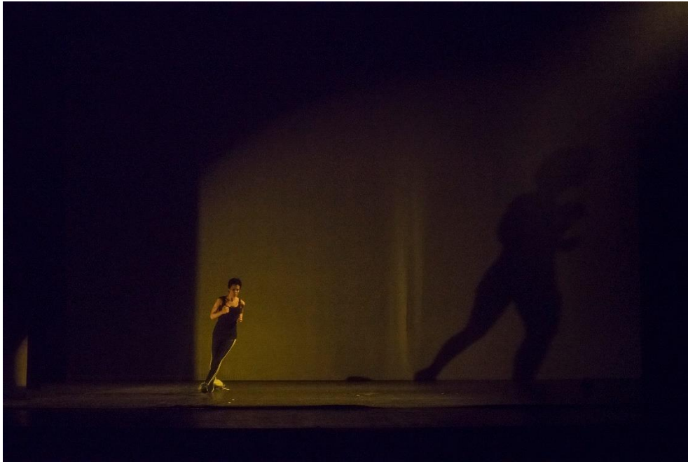
Fotografía de Alberto Reverón